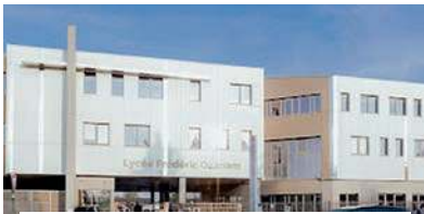
Structure d'entraînement et de formation Cyclisme au Lycée OZANAM