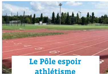
Le Pôle espoir athlétisme Stade Roger Belliard