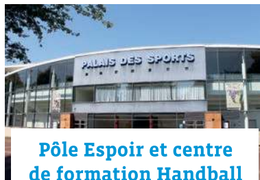
Pôle Espoir et centre de formation Handball Palais des Sports