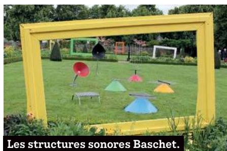
Les structures sonores Baschet.

Du 29 juin au 3 juillet tous les élèves de CP et CE1 des groupes scolaires de Cesson-Sévigné participeront à la semaine des arts.