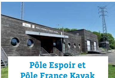
Pôle Espoir et Pôle France Kayak et le Stade d'eaux vives