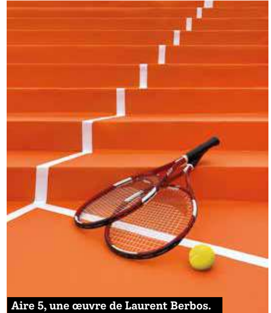
Aire 5, une œuvre de Laurent Perbos.