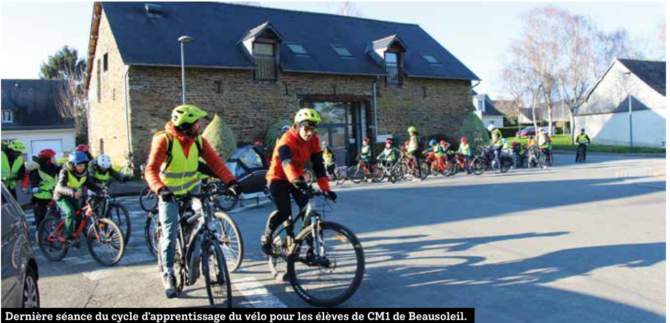
Dernière séance du cycle d'apprentissage du vélo pour les élèves de CM1 de Beausoleil.

La Ville participe au dispositif national "Savoir rouler à vélo". Des agents de la Base Sports Nature et de la police municipale dispensent des séances aux élèves de CM1 des écoles Beausoleil, Bourgchevreuil et Notre-Dame pour favoriser l'autonomie à vélo des futurs collégiens.