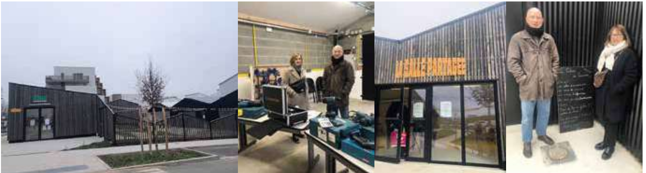
Inauguration de la Cabane dans le quartier ViaSilva

Nous étions présents le 13 janvier à l'inauguration de La Cabane , lieu de rencontres, de partage et de services, géré par les Conciergeries Rennaises, pour les habitants du quartier ViaSilva. Nous plébiscitons ce type d'initiative en faveur du bien vivre ensemble, qui permet de construire du lien entre les Cessonais et les associe en amont à la démarche . Ce projet répond à une attente forte des habitants et constitue une forme nouvelle d'appropriation de la vie de quartier par les habitants eux-mêmes .