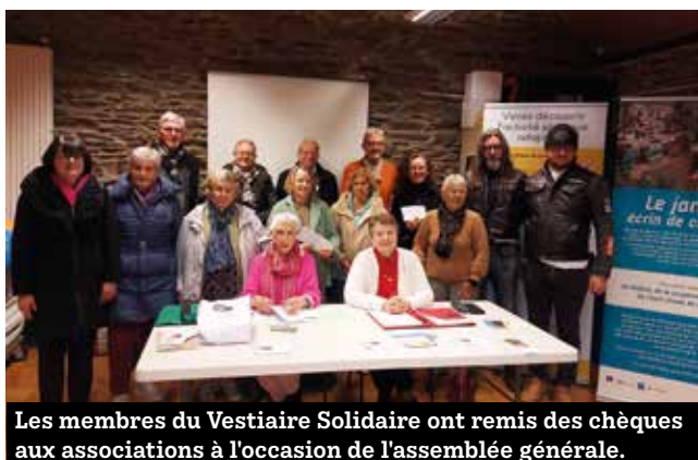
Les membres du Vestiaire Solidaire ont remis des chèques aux associations à l'occasion de l'assemblée générale.