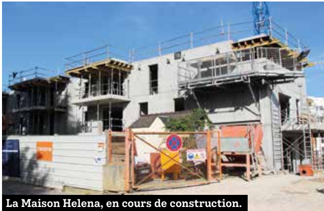
La Maison Helena, en cours de construction.

La direction des solidarités travaille également au bien être des seniors sur notre territoire. Entre, habitat et transport, plusieurs projets sont en cours pour faciliter et accompagner la vie des plus âgés.