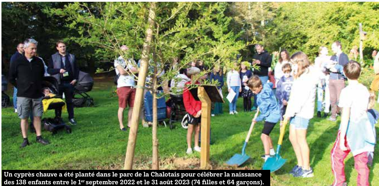
Un cyprès chauve a été planté dans le parc de la Chalotais pour célébrer la naissance des 138 enfants entre le 1 er septembre 2022 et le 31 août 2023 (74 filles et 64 garçons).