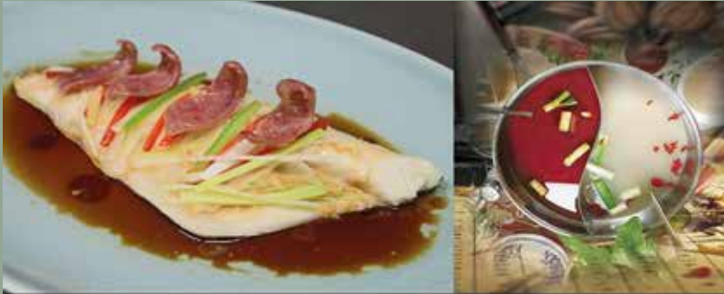
Filet de bar et saucisse chinoise au Mei Gui Lu à la vapeur, sauce soja assaisonnée pour fruits de mer

48 rue de Bray - 35510 CESSON-SÉVIGNÉ - Tél : 02 99 83 74 28 - patricehuline@orange.fr