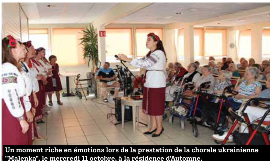
Un moment riche en émotions lors de la prestation de la chorale ukrainienne "Malenka", le mercredi 11 octobre, à la résidence d'Automne.

* affaires-sociales@ville-cesson-sevigne.fr ; 02 99 83 52 31