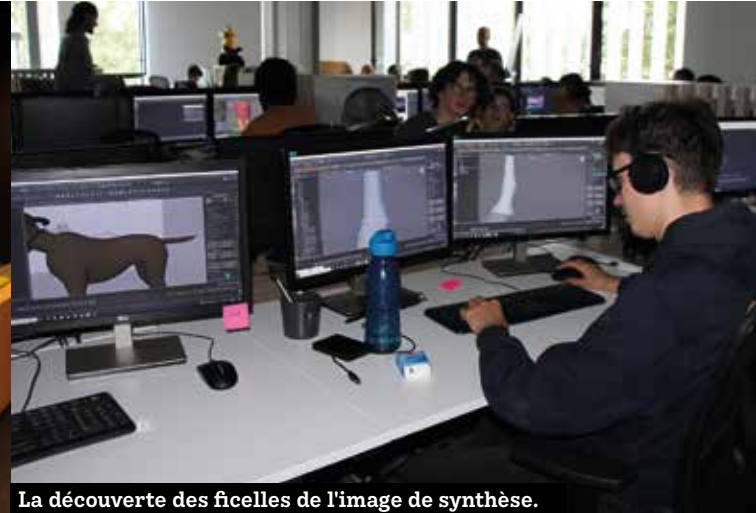
La découverte des ficelles de l'image de synthèse.

Creative Garden vient de s'installer à ViaSilva, dans le nouveau bâtiment de Creative Seeds, face à la station de métro. L'association propose des ateliers et des stages sur le thème de l'image de synthèse à l'année ou pendant les vacances scolaires.