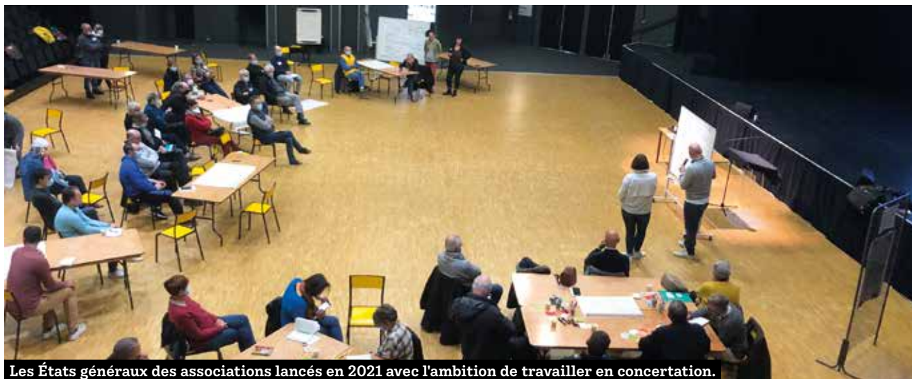
Les États généraux des associations lancés en 2021 avec l'ambition de travailler en concertation.