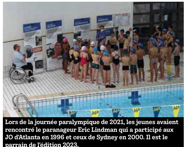
Lors de la journée paralympique de 2021, les jeunes avaient rencontré le paranageur Eric Lindman qui a participé aux JO d'Atlanta en 1996 et ceux de Sydney en 2000. Il est le parrain de l'édition 2023.

Cette journée nationale est l'occasion pour chacun d'entre nous de découvrir les différents sports paralympiques et les athlètes avant l'incroyable spectacle sportif des Jeux paralympiques 2024. Le 9 octobre 2023, 2,8 millions de billets pour les Jeux paralympiques seront mis en vente sans tirage au sort sur la plateforme de Paris 2024.