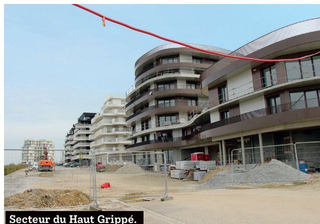
Secteur du Haut Grippé.