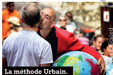
La méthode Urbain.

Théâtre, humour et mentalisme. Devenez maître du monde en 5 stratégies et moins d'une heure. À partir de 8 ans.