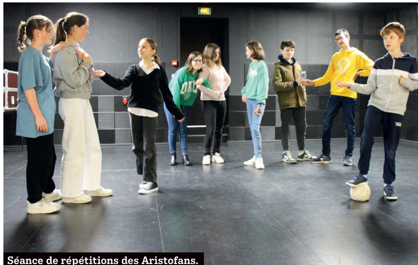
Séance de répétitions des Aristofans.

Pendant les cours, les jeunes font de l'improvisation, du travail théâtral comme les déplacements, le placement de voix, du corps... À partir du mois de décembre, place aux répétitions pour les spectacles de fin d'année scolaire, avec le choix des pièces, la distribution des rôles, et l'apprentissage des textes... Morgann, 11 ans,