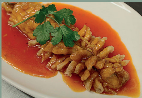
Poisson mandarin en forme d'écureuil filet de bar frit à la sauce aigre-douce