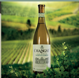
Vin sélectionné - ChangYu Riesling Fruité, élégant, exotique et équilibré, un riesling différent et délicieux.

L'abus d'alcool est dangereux pour la santé.