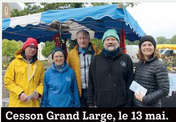
Cesson Grand Large, le 13 mai.