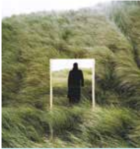
La bouche pleine de terre