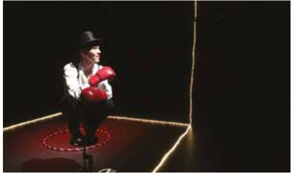
L'effort d'être spectateur

Lors d'un examen médical, un homme apprend que sa fin peut être proche. Il décide alors de fuir tout contact humain et de rentrer dans son Monténégro natal. Sur la route, il rencontre deux chasseurs qui commencent inexplicablement à le poursuivre. Démarre alors une course haletante, symbolique et métaphysique dans laquelle l'auteur fait alterner