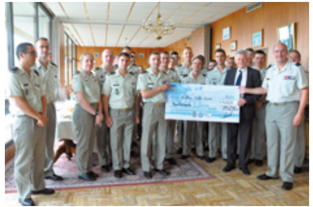
Remise d'un chèque de 4 000 € vendredi 23 juin à l'école des Transmissions, montant des recettes de l'opération Solid'Terre au profit des blessés de l'armée de Terre.