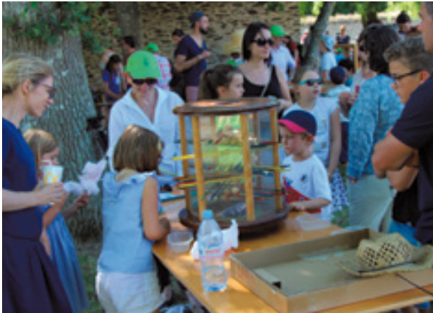
Petits et grands ont participé à la 2 e édition de la fête des familles, dimanche 25 juin, dans le parc du Pont des Arts.