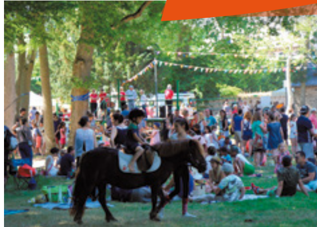
Au programme, 40 activités à partager : jeux, promenades en poney, animations culturelles et sportives...