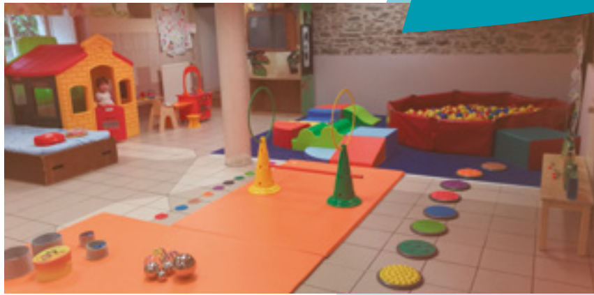
L'espace-jeu de Bourgchevreuil

Rappel : Nous sommes à la recherche de personnes bénévoles pour cette