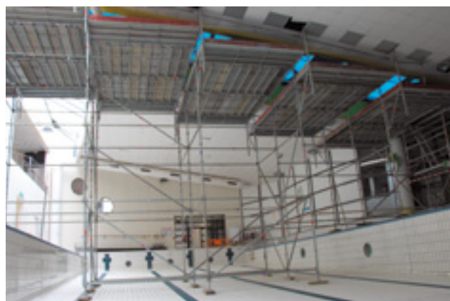
Des travaux ont été effectués à la piscine tout l'été, notamment au bassin sportif.