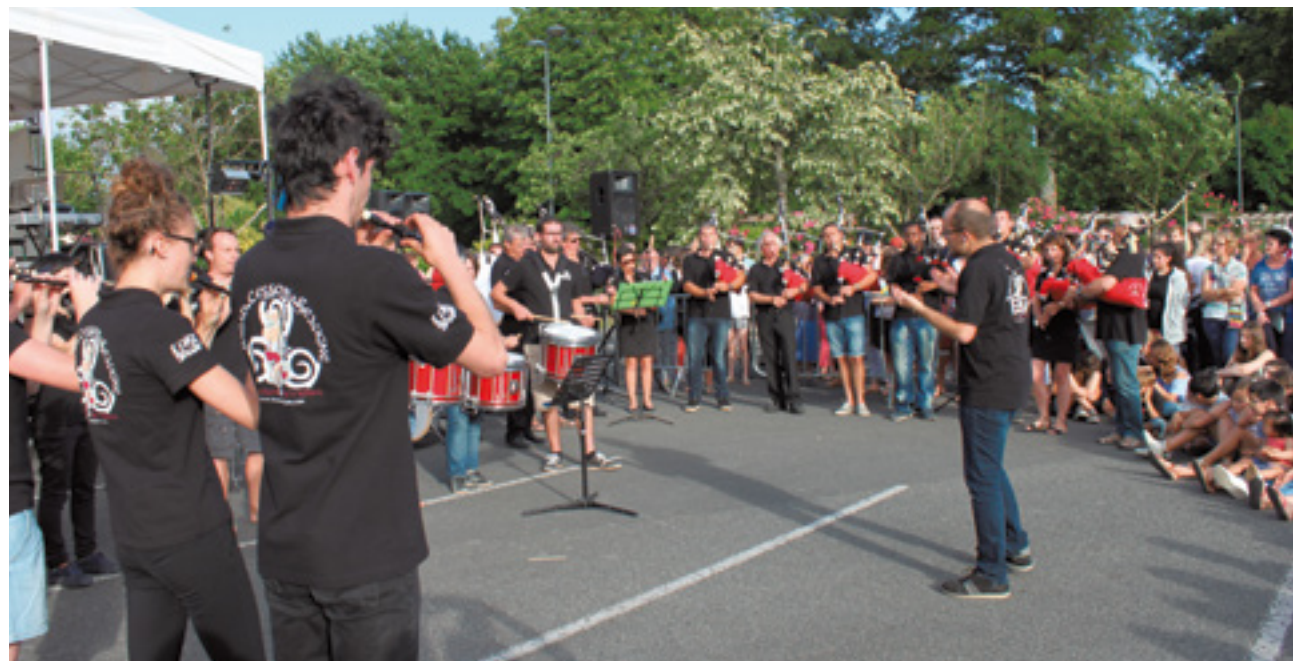
Sortez c'est l'été, samedi 24 juin, dans le centre-ville : événement incontournable, mêlant fête de la musique, bal populaire et feu d'artifice, qui a de nouveau attiré la foule, avec un dispositif de sécurité soutenu par les bénévoles.