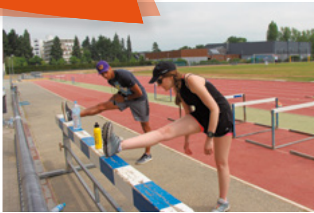
Semaine du sport en entreprise, du 19 au 23 juin. De nombreuses activités étaient proposées tout au long de la semaine. 25 entreprises y ont participé.