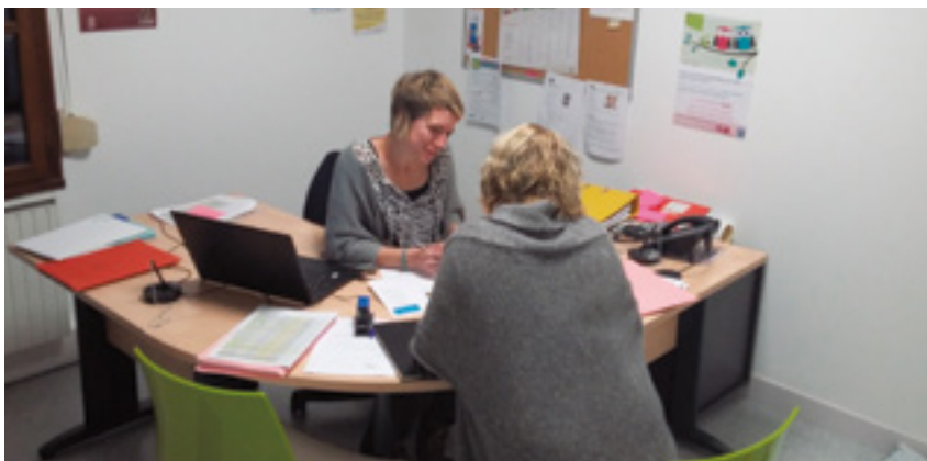
Le relais assistantes maternelles (RAM)

Permanence juridique couvrant les domaines du droit de la famille (rupture de couple, garde d'enfant, pension, violences intrafamiliales...) ; et du travail (rupture de contrat, congé parental, harcèlement).