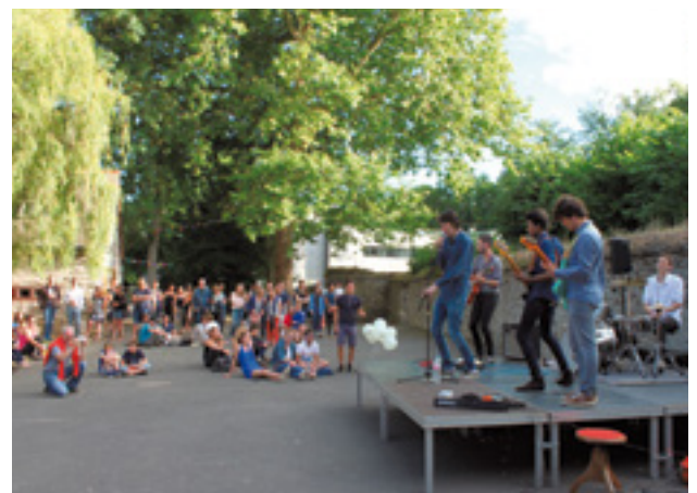
Toutes les générations se sont réunies autour de la musique.