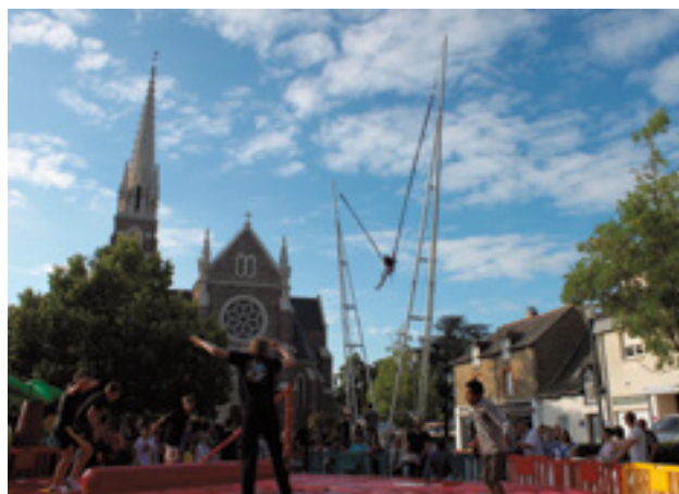
L'Ucal a proposé à cette occasion des animations place de l'église.