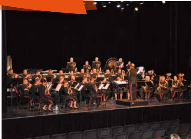
Le concert Unisson a connu un vif succès. Il était donné le 11 mai au profit des soldats blessés. La salle du Carré Sévigné a affiché presque complet.