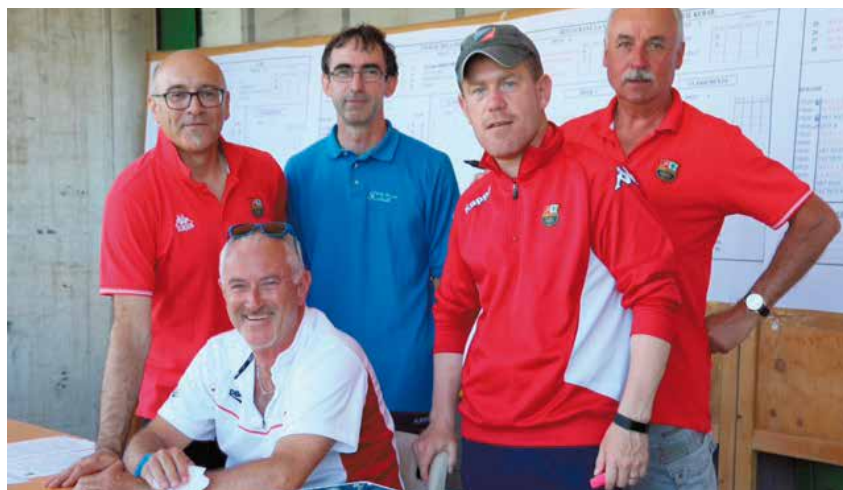
Les organisateurs du tournoi