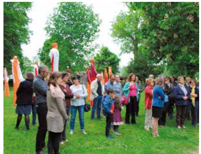
L'exposition est visible jusqu'au 31 août, parc de Bourgneuil, à droite du Pont des Arts.