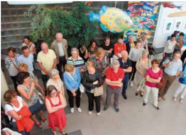
Vernissage de l'exposition des oeuvres des élèves de l'école d'arts plastiques, mercredi 31 mai. Les travaux étaient exposés dans le hall du Pont des Arts et à la Galerie Pictura.