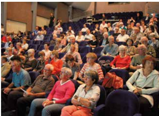
La réunion publique sur l'étude urbaine axe Est-Ouest et Centre-ville, mardi 16 juin, à l'auditorium du Pont des Arts, a intéressé de nombreux habitants.