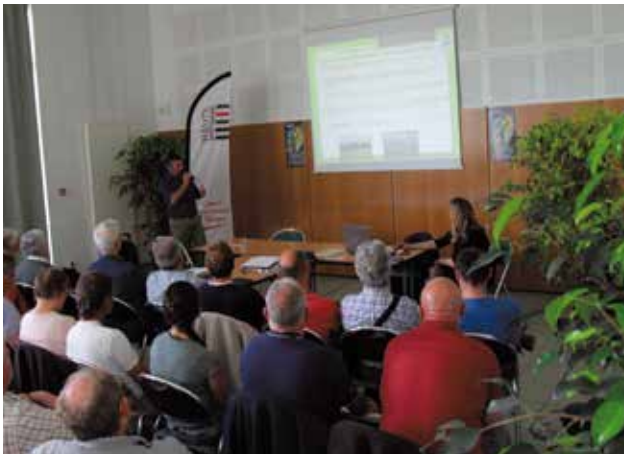
Colloque du comité du tourisme organisé à l'Espace de Grippé mardi 16 juin : les techniques alternatives aux produits phytosanitaires.