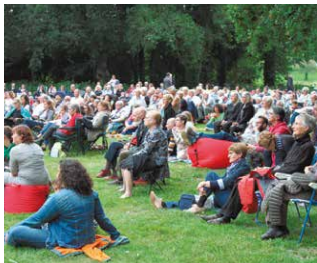
Les Cessonaises et Cessonais étaient nombreux à suivre la retransmission en direct de "Carmen" donné à l'opéra de Rennes.