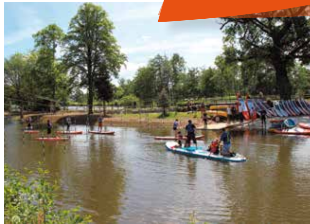
122 femmes ont participé à "Sup'air woman2" organisé à la Base Sports Nature samedi 20 et dimanche 21 mai par l'association BoldeSup'air.