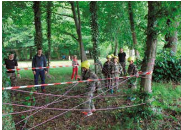
Action Transolid'terre, parc de Bourgchevreuil, mercredi 7 juin, organisée par l'école des Transmissions en soutien aux blessés de guerre.