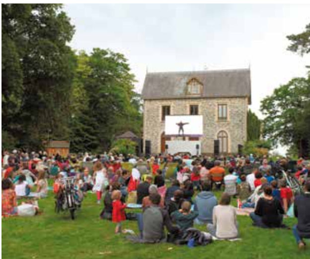
Écran géant installé dans le parc de la Monniais pour la diffusion de l'opéra de plein-air, "Carmen" de Bizet jeudi 8 juin.