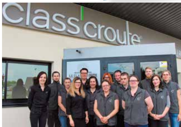
L'équipe de Class'route

Class'route est ouvert du lundi au vendredi, tous les midis (livraison traiteur le soir).