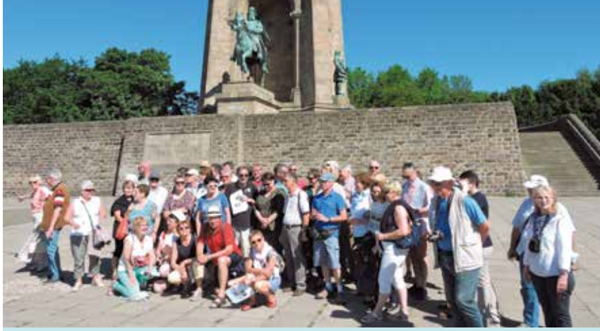
Le groupe Waltrop-Cesson sous la statue du Roi Wilhem-Denkmal à Hohensyburg