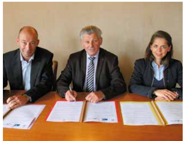
Signature d'une convention avec l'école Notre-Dame le 24 septembre.