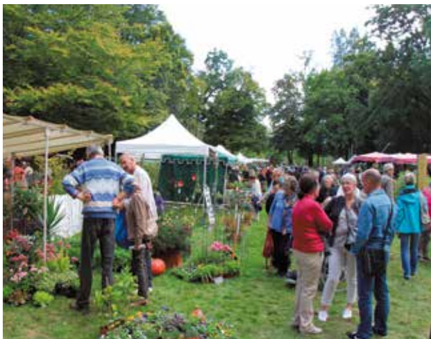
Gros succès du salon Délices de plantes les 19 et 20 septembre .