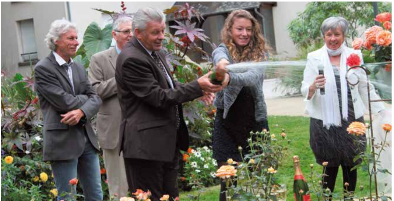
Le baptême de la rose ViaSilva® le 15 septembre s'est déroulé dans le parc de la Chalotais.