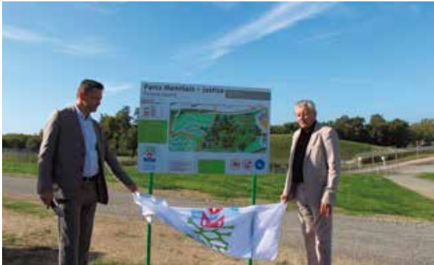
Inauguration des parcours sportifs au Bois de la Justice, samedi 26 septembre.