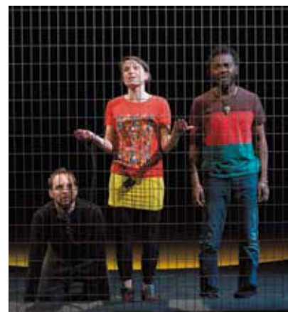
La place du chien

Tarifs : plein, 22 € ; réduit, 20 € et jeune, 14 €.