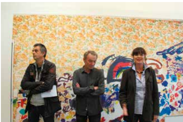
Vernissage de l'exposition Tympan, lundi 5 octobre, Galerie Pictura.