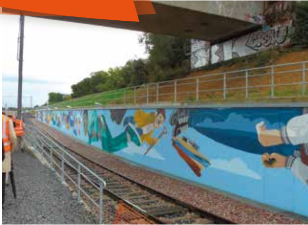
Inauguration de la fresque le long de la future ligne LGV mercredi 16 septembre.