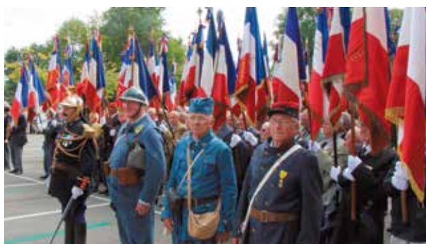
Présentation des costumes des soldats des différentes époques.