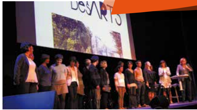
Présentation de la Saison Culturelle le 25 septembre au Carré Sévigné.