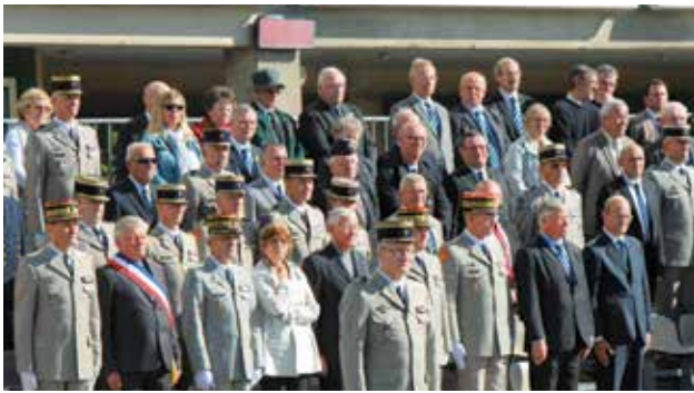
Célébration de la Saint-Gabriel à l'école des Transmissions le 25 septembre.