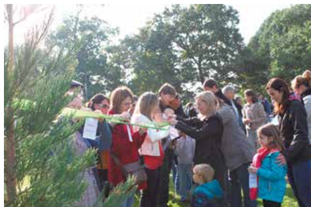
Plantation de l'arbre des naissances, samedi 10 octobre, à Champagné.