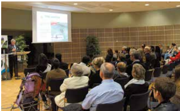
Accueil des nouveaux habitants le 3 octobre à l'Espace Citoyen.