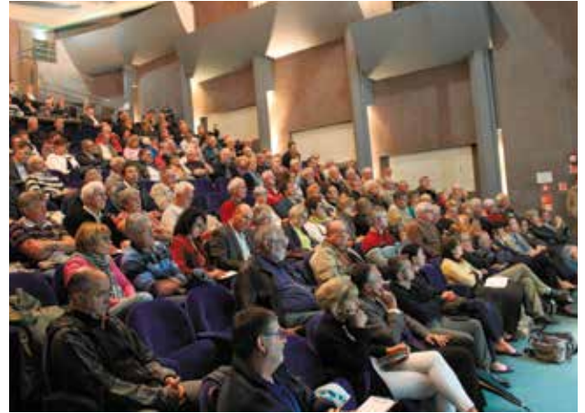
Réunion publique sur l'annulation du Plu mercredi 16 septembre. Celle concernant ViaSilva a eu lieu jeudi 8 octobre.