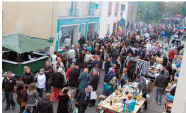
La foule à la braderie, organisée le dimanche 4 octobre.