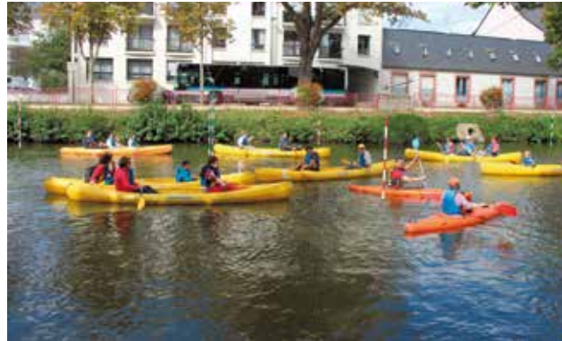
Conférence embarquée dans le cadre du Festival des sciences, samedi 26 septembre, au stade d'eaux-vives.