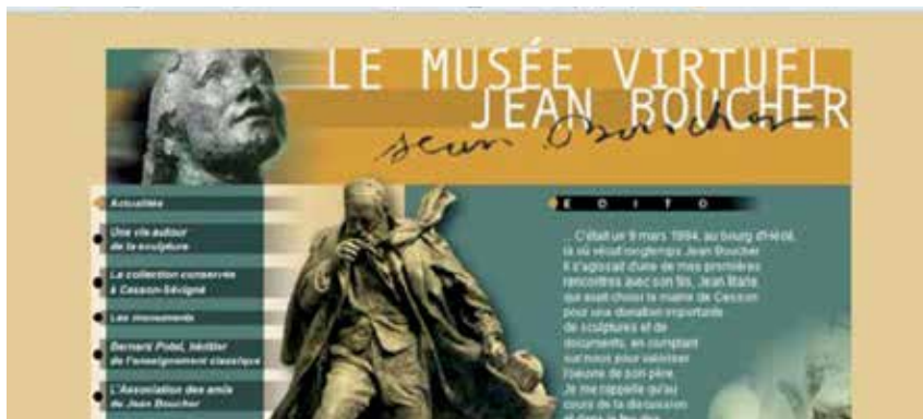
Capture d'écran du musée virtuel Jean Boucher disponible sur le site de la Ville.

La Ville possède le fonds le plus important des œuvres de Jean Boucher. Cesson-Sévigné est d'ailleurs la seule à prêter des documents de l'artiste. Une convention a été établie entre la Ville et l'institut Liu Kaigu pour l'ensemble du prêt des œuvres. Tous les frais pris en charge par la ville de Shanghai. Une 2 e exposition de plus grande envergure des œuvres de Jean Boucher est prévue en Chine, en octobre 2016, avec des sculptures de l'artiste.