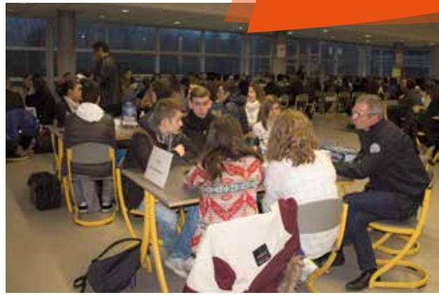
Petit-déjeuner des métiers au lycée Sévigné, mercredi 27 janvier : les lycéens ont rencontré des professionnels.