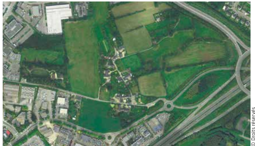
Le site existant du Chêne Morand.