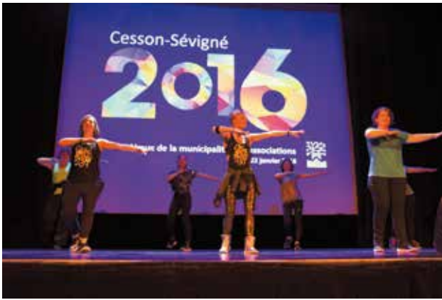
L'association Zumb'attitude a animé la soirée des vœux aux associations.