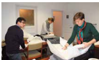
Derniers préparatifs avant le départ.