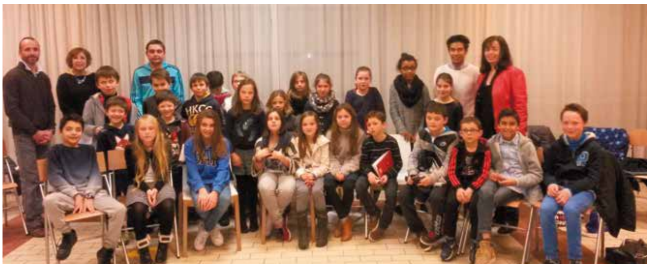
Rencontre de trois jeunes élus du CMJ de Cesson-Sévigné avec leurs homologues bruzois, samedi 23 janvier.

À noter : l'entrée à la discothèque éphémère se fait sur inscription à cmj@ville-cesson-sevigne.fr ou 02 99 83 02 06.