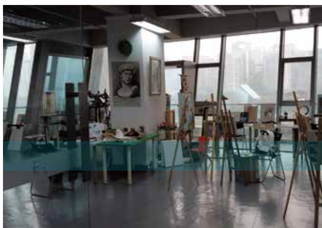
Atelier à l'institut Liu Kaigu à Chongqing.