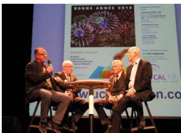
Les vœux aux entreprises le 20 janvier se sont déroulés au Carré Sévigné.