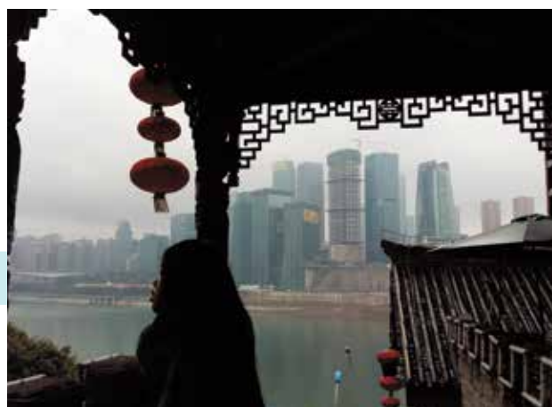
Chongqing, mégapole du Sichuan.