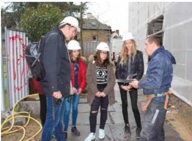
Visite du chantier de restauration de l'église par 16 élèves de 3 e du collège Bourchevreuil jeudi 4 février. Objectif, découvrir les métiers liés au patrimoine (taille de pierres, taille d'ardoises mais aussi le métier de Responsable d'équipe maîtrise d'ouvrage). Une visite des travaux était également au programme..