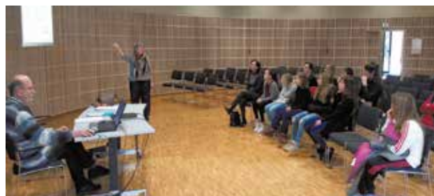
Réunion avec l'AESCD (association d'échanges solidaires Cesson-Dankassari) samedi 16 janvier à l'Espace Citoyen.

Les jeunes ne se limitent pas à l'organisation de la discothèque. Ils participent également à des rencontres, comme par exemple avec l'association cessonnaise AES-CD (Association d'échanges solidaires Cesson-Dankassari) le samedi 16 janvier avec le compte-rendu de l'action