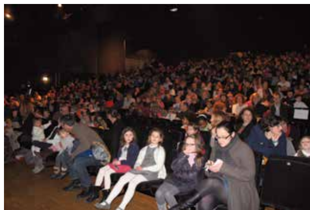
Le traditionnel Noël des Petits Cessonnais a eu lieu samedi 16 janvier, au Carré Sévigné. À gauche, les lauréats du concours de dessin. À droite, le public, attentif. La salle était comble.