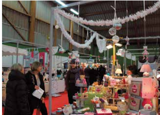
7000 visiteurs accueillis tout au long du week-end du marché de Noël, salle des tennis municipaux.