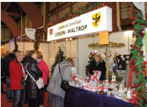
Parmi les exposants du Marché de Noël, le stand du comité de jumelage a proposé des produits des Waltropiens.