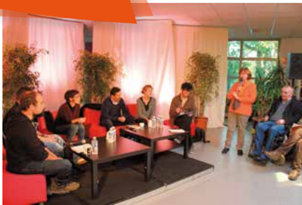
Lors de la Semaine de la solidarité internationale, fin novembre, de nombreuses animations ont été proposées sur le thème "La mobilité, un levier d'inclusion sociale"