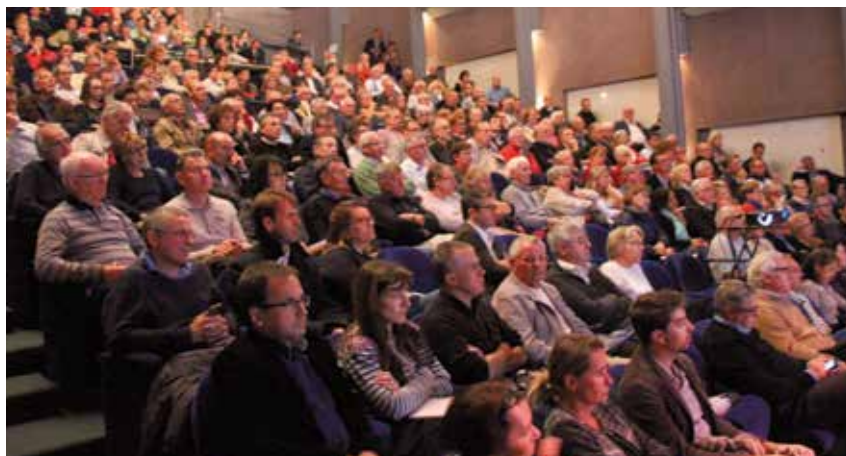
Réunion publique du 8 octobre sur la présentation du nouveau projet ViaSilva

ViaSilva se structure et s'adapte aux zones écologiques et naturelles existantes, pas l'inverse !