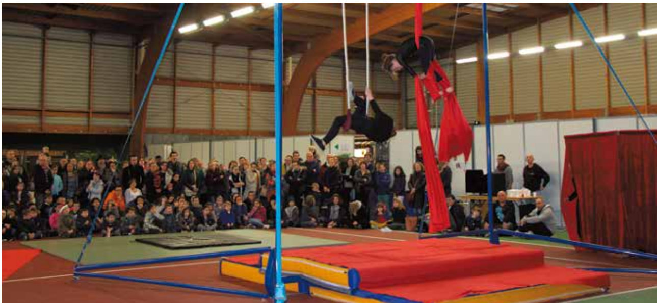
De nombreuses animations ont rythmé le marché de Noël : le Père Noël avec sa hotte de bonbons, un manège pour les enfants, des séances gratuites de maquillage pour les petits, des démonstrations de l'école cessonnoise du cirque « En piste », animation musicale du pôle Musique de la Ville...