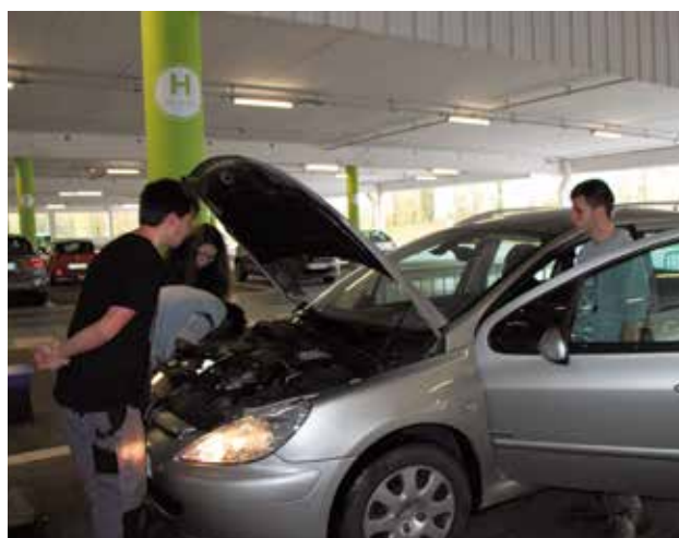
L'opération lumière et vision, du lundi 23 au vendredi 27 novembre était proposée en partenariat entre la police Municipale, des élèves du lycée Frédéric Ozanam et la prévention routière.