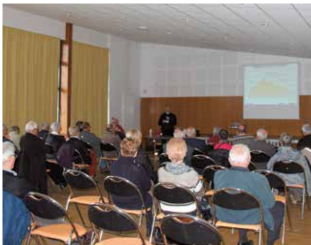
Judi 26 novembre, une cinquantaine de personnes a participé à l'Espace de Grippé à la journée d'information "Seniors au volant" proposé par la Ville en partenariat avec Clic'Alli'âges et la Prévention routière. L'objectif de cette opération est de permettre aux seniors de rester autonomes le plus longtemps possible. Après la théorie pendant toute la matinée, place à la pratique l'après-midi, avec notamment un simulateur de conduite et des tests de code de la route avec les nouveaux panneaux.