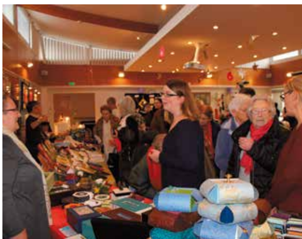
Marché de Noël à Beausoleil jeudi 26 et 27 novembre. 20 exposants ont proposé leurs créations. Un moment de convivialité qui s'est poursuivi autour d'un vin chaud.