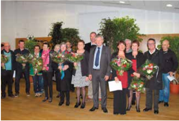
Cérémonie des médaillés du travail et retraités de la Ville, vendredi 27 novembre, à l'Espace de Grippé.