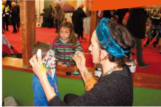
Marché de Noël des 5 et 6 décembre organisé par le Comité de Jumelage : les séances de maquillage ont été très appréciées.