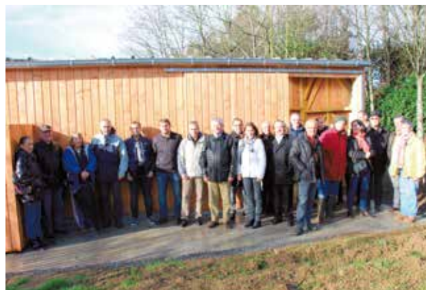
Inauguration des jardins de partage, samedi 21 novembre, à proximité du pôle France kayak. 20 familles vont pouvoir jardiner au bord de la Vilaine.