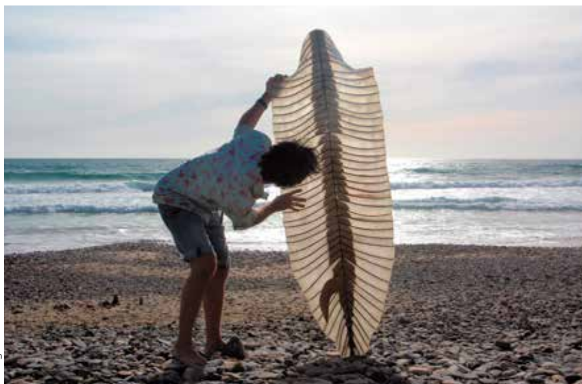
Exposition Émergence présentée du 13 décembre au 8 février à la Galerie Pictura.

Nous allons, dès l'année prochaine poursuivre cet effort notamment en modernisant l'accueil public de la médiathèque, en ajustant les aménagements techniques du Carré Sévigné et en améliorant son accueil du public.