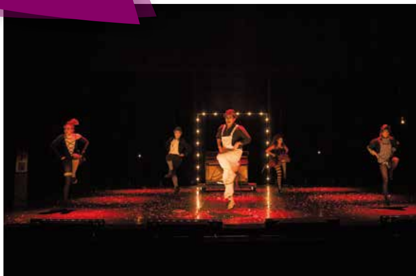
Arlequin poli par l'amour