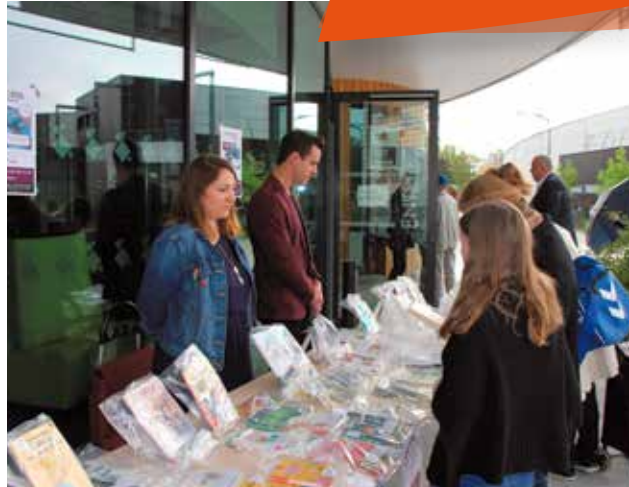
Lâcher de livres voyageurs samedi 1 er octobre devant l'Espace Citoyen. Le principe ? Lire le livre puis le déposer dans un endroit public.