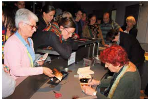
Anne Sylvestre s'est prêtée à une séance de dédicaces à l'issue du spectacle présenté au Carré Sévigné pour l'ouverture de la Saison Culturelle.