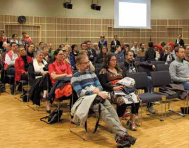
Accueil des nouveaux habitants samedi 1 er octobre à l'Espace Citoyen. 70 personnes étaient présentes pour se renseigner sur les différents services proposés par la Ville.