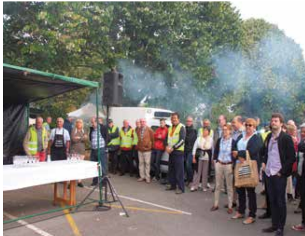
Cette année, le nombre de bénévoles a été multiplié par trois pour répondre aux préconisations de la Préfecture. Les services municipaux se sont également mobilisés.