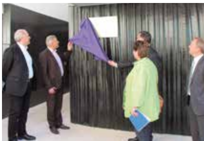
Le dévoilement symbolique pour l'inauguration

L'inauguration de la résidence Cours Vilaine située Cours de la Vilaine sur le site de l'ancienne mairie et de l'ancienne école communale s'est dérou-