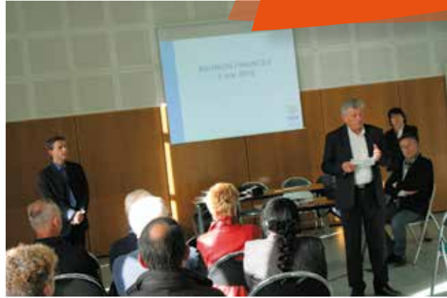
La réunion publique sur la présentation du budget 2015 et des contraintes financières de la commune s'est déroulée mardi 5 mai, à l'Espace de Grippé. L'occasion pour les Cessonnois de poser toutes les questions concernant ce domaine.