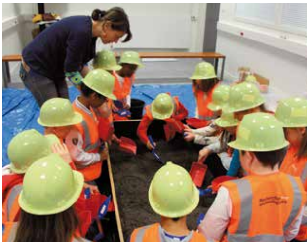
Des ateliers d'archéologie ont été mis en place avec les scolaires des écoles Beausoleil, Bourcchevreuil et Notre-Dame et des professionnels de l'Inrap en lien avec l'exposition Sur les rails présentée au Centre Culturel.