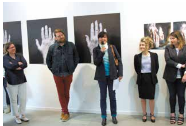
Vernissage de "Génération" à la Galerie Pictura mardi 28 avril, une exposition collective d'élèves des écoles d'art de la région : l'institut Supérieur des Arts Appliqués de Rennes et les apprentis du Brevet technique des métiers de la photographie de la faculté de Rennes.