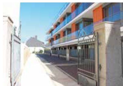
Le portail de l'ancienne mairie école a été conservé.

un gabarit cohérent avec l'environnement existant, avec un rez-de-chaussée, deux étages et un niveau attique, le tout sur un niveau de sous-sol.