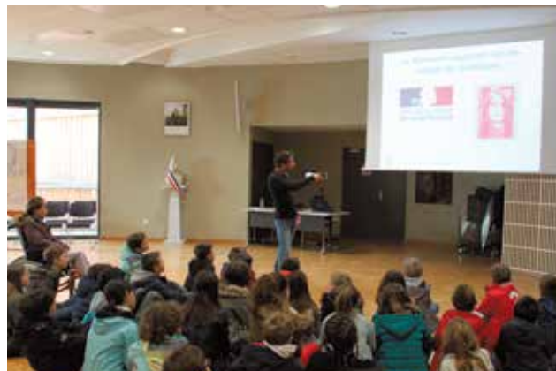
Journée citoyenne jeudi 7 mai. Les élèves des écoles primaires ont participé à des ateliers le matin proposés par le service Éducation Jeunesse de la Ville, et les associations cessonnoises UNC et Cesson Mémoire et Patrimoine.