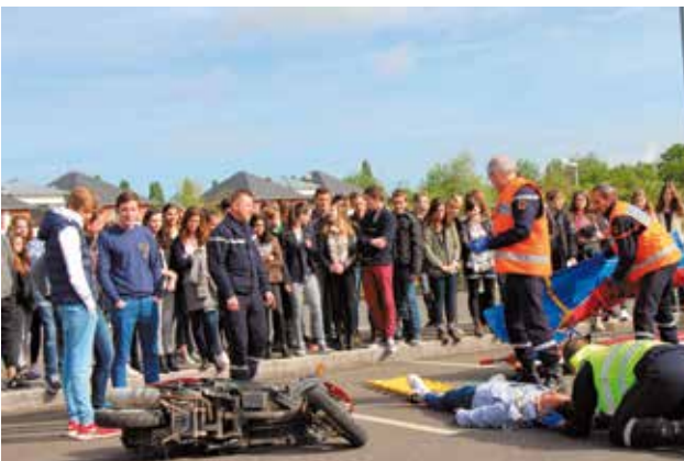
Journée de prévention routière jeudi 7 mai pour 800 élèves de Cesson-Sévigné parking de Grippé. Un projet réunissant la Ville et les établissements scolaires (le Lycée Saint-Étienne, le Lycée Sévigné et le collège de Cesson-sévigné).