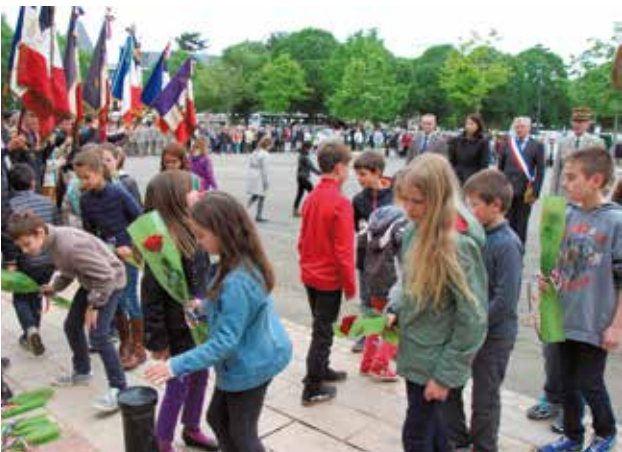
La journée citoyenne du jeudi 7 mai a été marquée l'après-midi par la cérémonie militaire place du Marché. L'après-midi était organisée par l'École des transmissions conjointement avec la Ville, l'inspection de circonscription de l'éducation nationale et l'UNC.