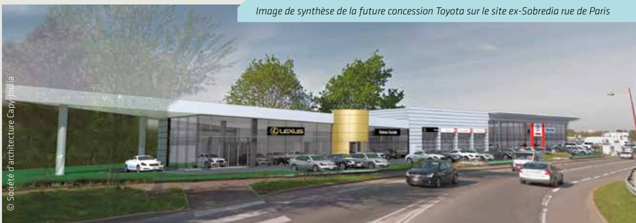
Image de synthèse de la future concession Toyota sur le site ex-Sobredia rue de Paris

Cela passe par le développement de la ZAC du Chêne Morand qui permettra -dès 2018- de regrouper sur ce site, qui prolongera les concessions déjà existantes sur le Bd des Alliés, de nouvelles concessions qui viendront enrichir l'offre avec une visibilité accrue en bordure de ce boulevard. D'ores et déjà, un certain nombre de constructeurs se positionnent sur cette nouvelle zone d'activité. Cela renforcera la cohérence d'ensemble de l'autopôle cessonnois et raffermira davantage l'ancrage historique de l'automobile sur notre commune. Notre ambition politique et surtout économique est de promouvoir l'emploi dans ce secteur et de consolider l'autopôle dans sa position de fer de lance du bassin métropolitain. Pour cela, nous ne ménagerons aucun effort pour continuer à travailler en toute confiance et en très bonne intelligence avec les opérateurs existants. Nous mettrons également tout en œuvre pour faciliter l'installation de nouveaux arrivants avec toutes les retombées économiques bénéfiques pour toutes les parties. Il s'agit, pour nous bien évidemment, de consolider le "capital emplois" du secteur qui représente à ce jour 650 salariés et qui, nous l'espérons, offrira de réelles perspectives à l'avenir. Nous ne pouvons, par conséquent, qu'accompagner l'ensemble de l'autopôle pour le mettre en situation d'assumer toujours mieux sa mission économique, sociale au sens large du terme, et environnementale par la promotion de nouvelles technologies propres et innovantes.