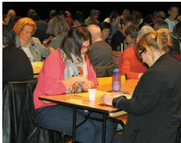
Le loto organisé par le Conseil Municipal des jeunes dimanche 26 avril au Carré Sévigné a réuni 191 personnes. Les 1 628 € de bénéfices ont été remis à la Passerelle, l'épicerie sociale.