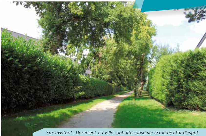
Site existant : Dézerseul. La Ville souhaite conserver le même état d'esprit pour les chemins à ViaSilva

Présentation du nouveau projet ViaSilva : jeudi 8 octobre à 19h Auditorium du Pont des Arts - Centre Culturel. Entrée libre.