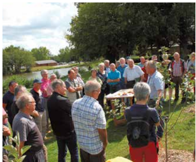
La démonstration d'écussonnage a attiré beaucoup de monde le 2 septembre au verger conservatoire.