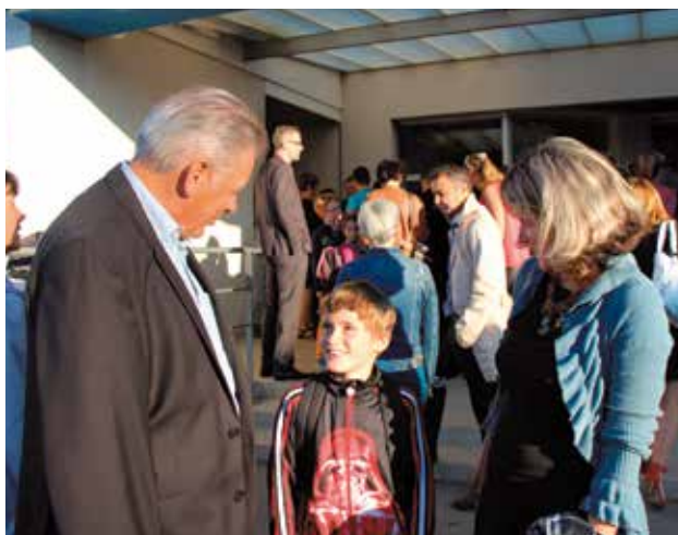
La rentrée scolaire s'est bien déroulée, mardi 1er septembre. Il n'y a pas eu de fermetures de classe dans les écoles publiques et l'école Notre-dame a ouvert une classe supplémentaire.