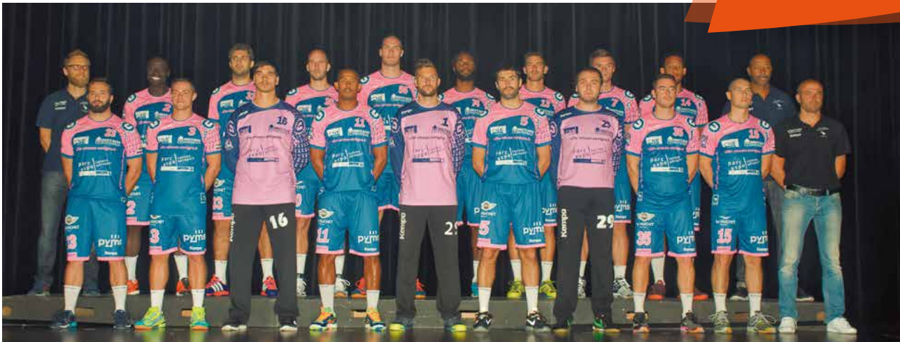
Le Cesson Rennes Métropole HB a présenté la nouvelle équipe 2015-2016 mercredi 1 er septembre. La 1 ère journée de D1 a débuté le mercredi 9 septembre au Palais des Sports.