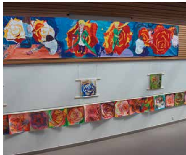
Les œuvres des élèves d'Arts Plastiques étaient présentées au Pont des Arts, créations en lien avec le baptême de la rose.