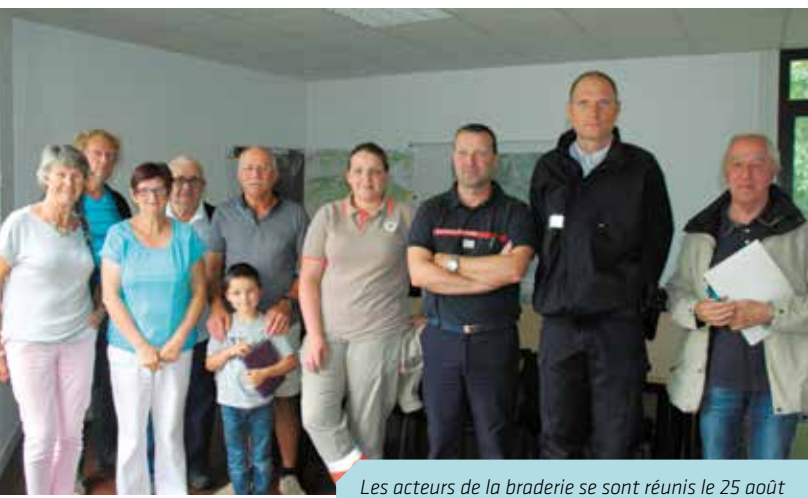
Les acteurs de la braderie se sont réunis le 25 août

C'est complet pour les bradeurs : place aux acheteurs ! www.braderie-cesson-sevigne.com