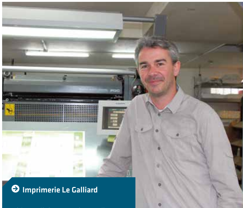
➔ Imprimerie Le Galliard

Ouverture du lundi au jeudi, de 8h à 12h et de 14h à 18h : le vendredi de 8h à 12h et de 14h à 16h.