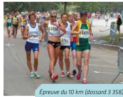
Épreuve du 10 km (dossard 3 358)

« Des athlètes ne paraissaient pas âgés et étaient en très grande forme. » Moralité : faire du sport conserve la jeunesse !