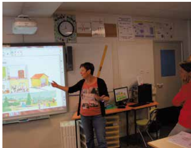
Visite des écoles le 28 août. Les élus ont souhaité porter l'accent sur l'équipement numérique des classes.