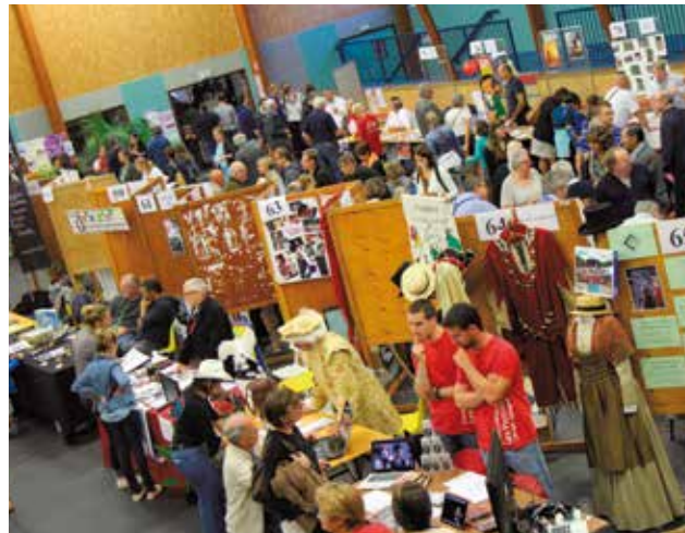
Le forum des associations, samedi 5 septembre, salle Paul Janson. Un rendez-vous incontournable qui a de nouveau mobilisé de nombreux Cessonnais tout au long de la matinée.