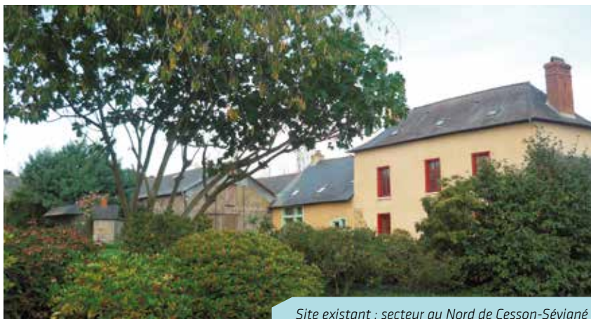
Site existant : secteur au Nord de Cesson-Sévigné

* délibération du Conseil municipal du 23 mars 2011