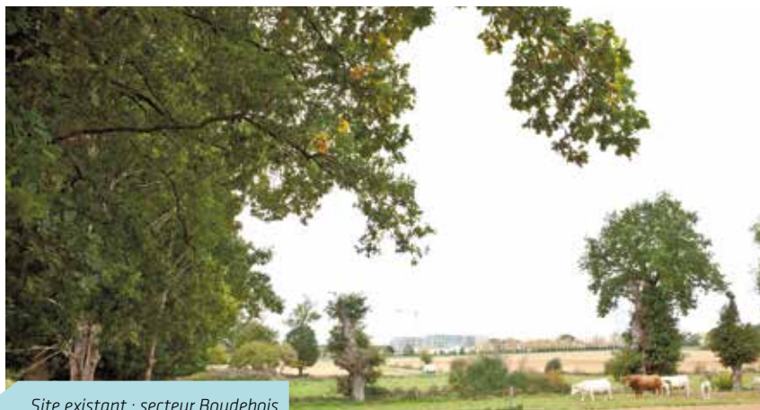
Site existant : secteur Boudebois

Dans un avenir plus lointain, les premiers logements devraient voir le jour vers 2019 et la fin des deux quartiers (Atalante-Champs Blancs et les Pierrens) vers 2040 au mieux selon les aléas, par exemple, ceux du marché immobilier.