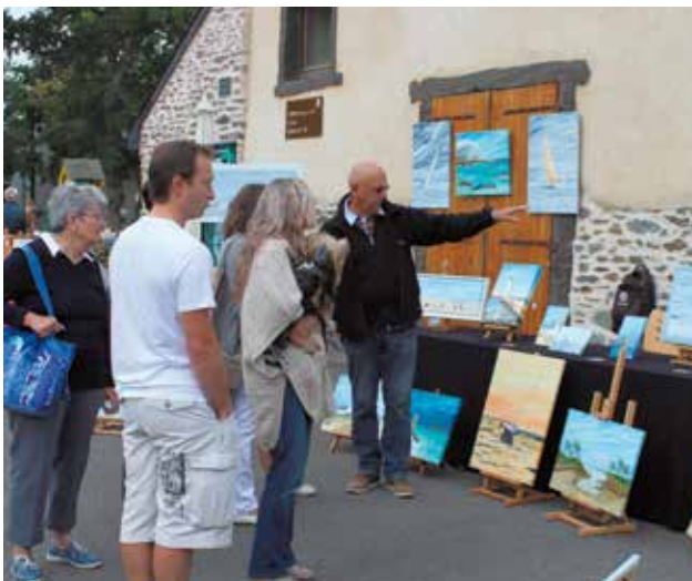
La foire aux arts organisée par l'association Cesson Arts et Poésie s'est déroulée dimanche 6 septembre.