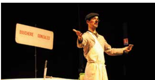
Le spectacle intitulé Provocation à la sécurité routière de la compagnie Lez Arts Verts a été proposé aux jeunes.

Cette action est le premier acte de deux mois de sensibilisation. Dans les établissements scolaires, des enseignants et des intervenants vont continuer ce travail autour des sujets comme les conduites addictives et des prises de risques sur la route. La campagne de prévention s'achèvera par une grande journée de la sécurité et prévention routière qui sera organisée à Cesson-Sévigné le vendredi 7 mai avec la formation des mêmes 780 jeunes. Différents ateliers seront proposés à l'Espace Grippé : simulateur de deux-roues motorisés, des lunettes de simulation d'alcoolémie, l'auto-test ceinture par exemple.