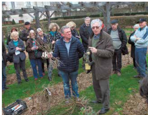
Taille des rosiers le 11 mars avec des conseils par la société d'Horticulture d'Ille-et-Vilaine et le service Espaces Verts de la Ville.