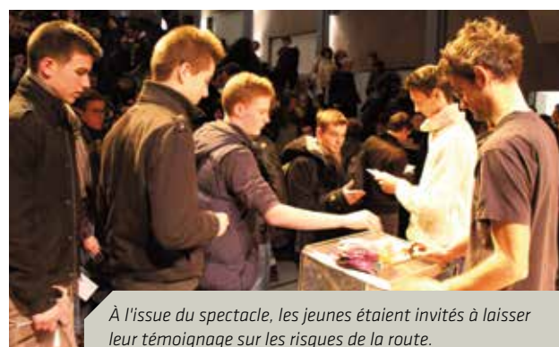
À l'issue du spectacle, les jeunes étaient invités à laisser leur témoignage sur les risques de la route.