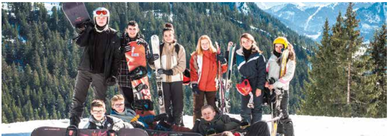
Dix jeunes Cessonnois ont découvert la station de Combloux en Haute-Savoie en février. Un séjour organisé et encadré par le service Jeunesse de la Ville en échange d'une activité "Espaces Verts" lors des Vacances de la Toussaint afin de profiter d'un séjour à la montagne à moindre frais. Un séjour organisé en partenariat avec l'association Cesson Vacances Nature.