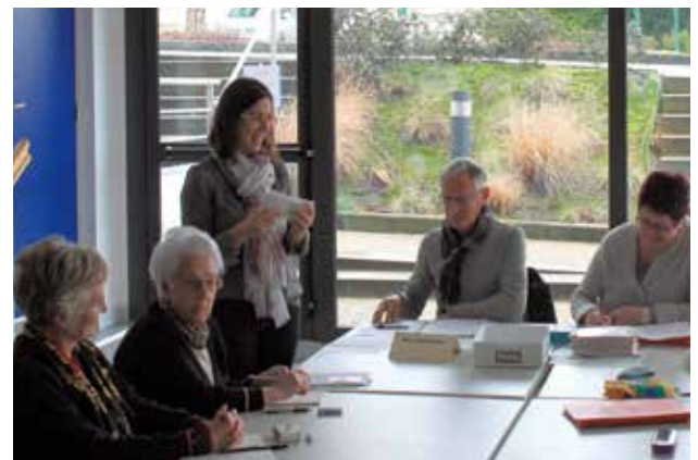
Clic All'âges propose un atelier mémoire salle des Vaux-Parés une fois par semaine, pendant 2 mois, jusqu'à la fin du mois d'avril. Cette série d'ateliers est complète. Une 2 nd e série sera programmée plus tard.