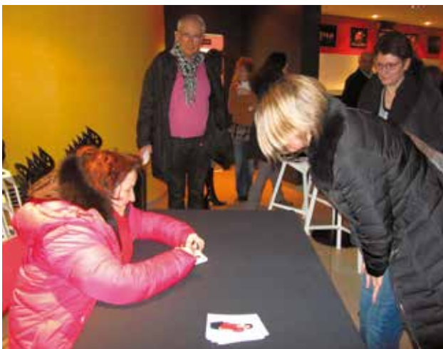
Anne Roumanoff en séance de dédicace mardi 10 mars après la représentation au Carré Sévigné de Anne [Rouge]manoff, qui a affiché complet.

Contacts : Sinikka Rostoll au 02 99 83 10 24 ; Ingrid Maslo au 07 50 43 68 80.