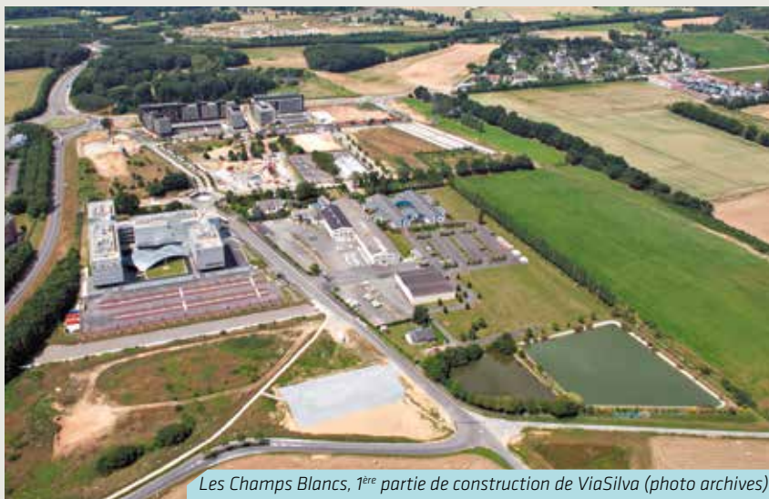
Les Champs Blancs, 1 ère partie de construction de ViaSilva

En 2019 on peut espérer une amélioration des ratios financiers grâce aux recettes fiscales apportées par les premières livraisons d'habitations à ViaSilva et au Haut Grippé.