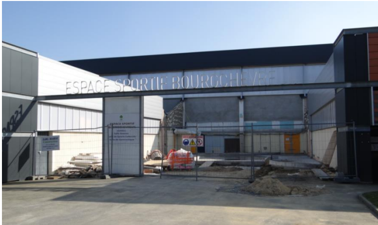
Photo Travaux en cours

Durée des travaux : 6 mois (de fin Janvier à Juillet 2016)