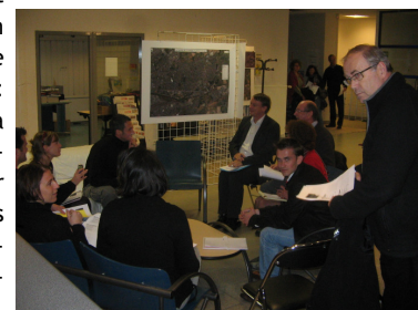
Le comité de pilotage a travaillé en petits groupes pour faire émerger des constats communs.

Ces questionnements vont faire l'objet de réunions en groupes de travail. Principe de ces groupes de travail : Amener les participants à exprimer et à poser les problèmes pour ensuite formuler des propositions de principes d'actions. Principes qui seront ensuite déclinés en fiches-actions.