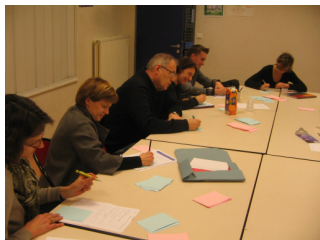
Les groupes de travail ont travaillé selon une méthode basée sur « Qu'est-ce qui est fait pour ...? » / « Qu'est-ce qui pourrait être fait pour ...? »