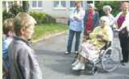
Des représentants du CMJ ont rencontré les résidents de Beausoleil pour des échanges très intéressants.