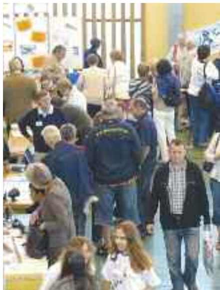
Le forum permet de réunir les associations en un seul lieu pour faciliter les échanges et les inscriptions aux activités.