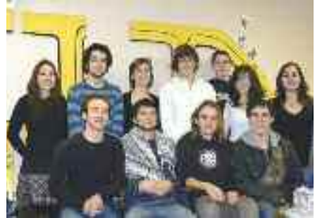
Des étudiants sont partis à Dankassari pour s'occuper de l'adduction d'eau potable jusqu'à fin juillet.