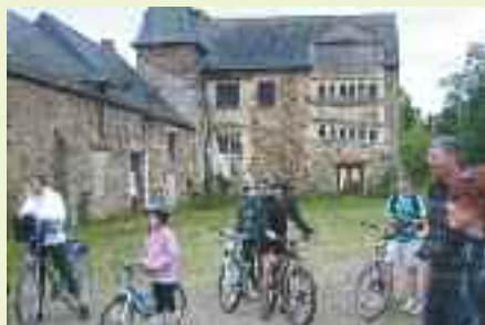
Le rallye a permis aux 70 participants de découvrir un circuit inédit autour de Cesson-Sévigné.

D ans le cadre de la fête du vélo, le 6 juin, l'OCC Cyclotourisme a organisé un rallye familial et convivial. Les 70 participants se sont retrouvés à la Maison des associations pour le départ. Au programme un parcours d'environ 35 km autour de Cesson-Sévigné ainsi que plusieurs jeux et énigmes à résoudre, notamment au château du Gué à Servon ou à Brécé où se déroulait le pique-nique. Des équipes de 2 à 8 participants se sont formées afin d'effectuer une boucle inédite, en bord de Vilaine. La journée s'est terminée par la remise des prix aux équipes les plus douées ainsi que par le pot de l'amitié.