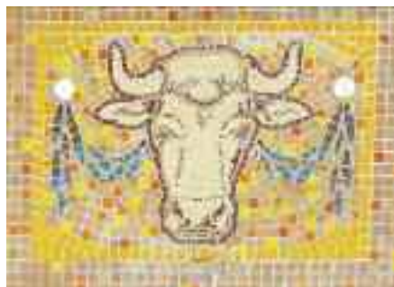
Les deux têtes de bovin seront confiées à l'association "Mosaïques et patrimoine".

Les travaux de réhabilitation du bâtiment du 14-16, cours de la Vilaine ont nécessité la démolition de l'enseigne de l'ancien commerce d'alimentation générale. Cela a permis de mettre à jour des mosaïques de Cargnelli, ouvrier de l'atelier Odorico, qui avait ouvert sa propre fabrique dans le