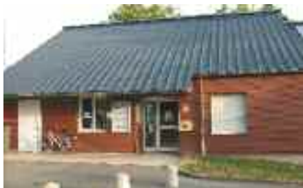
Des travaux de réhabilitation et de réorganisation ont débuté au stade d'eaux vives.

Construit en 1998, le bâtiment du stade d'eaux vives accueillait jusqu'en 2009 des activités municipales, le club Les Poissons Volants et le Pôle France. La construction du nouveau Pôle France a permis de libérer un espace de 70 m 2 qui permet aujourd'hui une réorganisation et une réhabilitation du bâtiment pour les deux entités restantes. Les travaux ont débuté et s'achèveront en fin d'année pour créer trois parties bien distinctes : administrative (bureau pour les éducateurs, salle de réunion...), stockage des bateaux (atelier de réparation, séchoir...) et vestiaires (augmentation du nombre, douches collectives...). Ce réaménagement va permettre une mise aux normes des conditions d'accueil des usagers, le développement de l'équipement pour les activités nautiques et de pleine nature, l'amélioration d'accueil de l'association et des meilleures conditions de travail pour les agents.