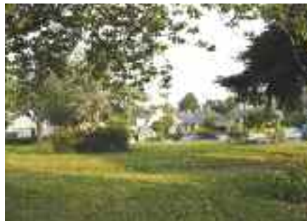
Les allées et la placette du square du Muguet vont être redessinées.