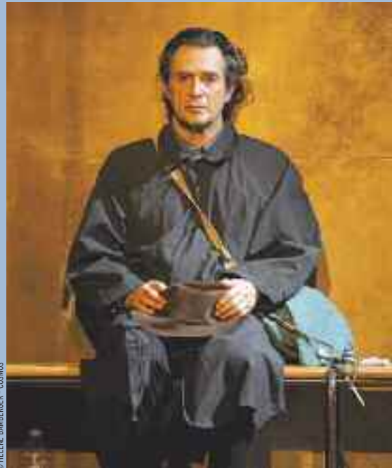
La pièce "Premier amour" de Samuel Beckett, avec Sami Frey, sera jouée le 7 décembre.