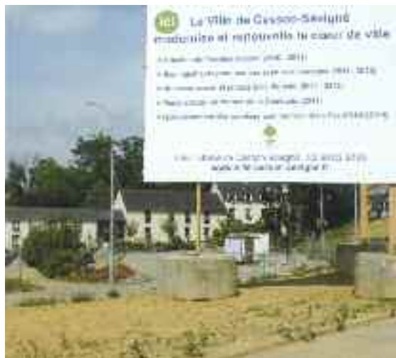
L'exposition des trois projets du futur Espace citoyen se déroulera du 7 juillet au 8 septembre.

Les avis réservés aux Cessonnaises et aux Cessonais sur les 3 projets de l'Espace citoyen devront être consignés sur un registre spécial tenu à la disposition du public au service de l'Urbanisme de la mairie.