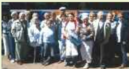
Les participants sont revenus ravis de leur séjour.

La municipalité souhaitait mettre en place un séjour pour les plus de 60 ans de la commune ayant des revenus modestes afin de leur per-