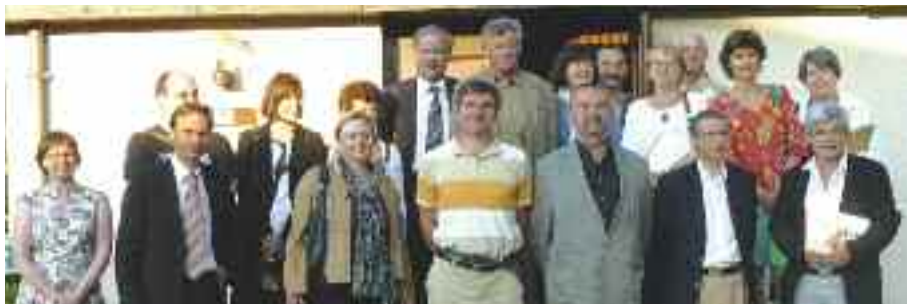
Dans le cadre du projet d'urbanisme Viasilva 2040, 16 cessonnois(es) ont été invités par le maire à rejoindre l'atelier d'urbanisme citoyen pour réfléchir à la ville de demain.

ce que sera Viasilva 2040, des Cessonnoises et des Cessonnois intéressés par l'avenir de la ville. "Quelle ville voulons-nous pour 2040, pour nous-mêmes, pour nos enfants, nos petits-enfants, pour celles et ceux qui viendront s'installer chez nous ?". C'est une démarche exaltante pour des personnes de professions différentes, habitant divers quartiers et la campagne, qui ont été choisies – hors de toute préoccupation politicienne – pour l'intérêt qu'elles manifestent pour leur cité. La première rencontre de l'atelier le 3 juin a été très fructueuse. Une seconde aura lieu en septembre sur le site de Viasilva 2040. D'une manière ou d'une autre, le Conseil Municipal des Jeunes sera saisi de ce dossier dans les mois à venir. Cinq thèmes ont été choisis pour orienter les réflexions de l'atelier :