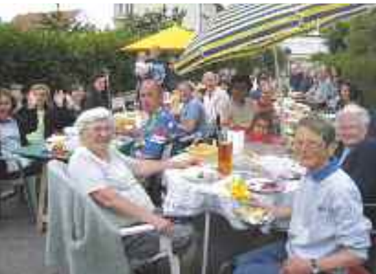
De nombreux habitants des Champs Péan se sont retrouvés pour un pique-nique convivial, le 20 juin.

Depuis le 23 juin, le système de badgeage aux centres de loisirs maternel et primaire a changé. Le pointage se fait désormais à l'arrivée de l'enfant ainsi qu'à sa sortie . Ce double pointage permet de comptabiliser les heures réelles de présence des enfants comme souhaité par la Caisse d'Allocations Familiales. Par mesure de bonne gestion, les responsables des centres de loisirs invitent fortement les parents à respecter cette nouvelle règle de badgeage.