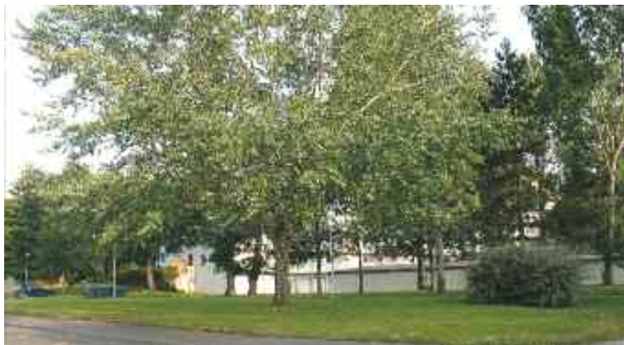
Un parking de 32 places va être aménagé sur l'espace vert situé en face de la future salle de tennis de table.