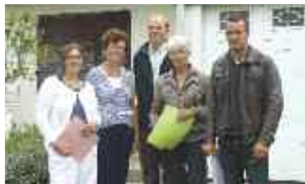
Le jury a visité les participants du concours, le 18 juin.