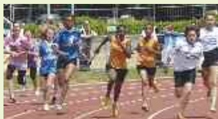
1 600 collégiens ont participé au championnat de France.

Le Championnat de France UNSS d'athlétisme s'est déroulé au stade municipal, du 12 au 14 juin. 120 équipes ont participé à ce championnat (60 de filles et 60 de garçons) avec, au total, 1600 sportifs collégiens. Le maire l'a souligné à l'occasion du pot officiel en présence des responsables nationaux, régionaux et locaux de l'UNSS : "La performance sportive de ces jeunes athlètes est intéressante mais ce qui frappe encore plus, c'est la mobilisation des jeunes officiels chargés de contrôler le bon déroulement et la régularité des épreuves." Cette dimension pédagogique se retrouve aussi au travers des journaux réalisés sur site par les collégiens de Bourgneuf. "Regards décalés...", titre de ce petit journal, a été réalisé avec enthousiasme et souvent avec talent. Les