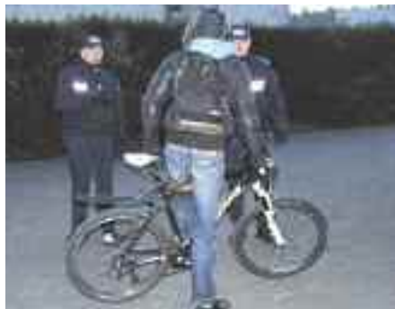
La Police municipale a effectué une opération préventive aux abords du lycée Sévigné, le 30 novembre.

À cette saison, les jeunes qui se rendent à l'école en vélo ou en cyclo doivent penser à être bien éclairés. Il en va de leur sécurité ! Dernièrement, la Police municipale a effectué deux contrôles préventifs au collège et au lycée Sévigné. Plusieurs vélos et scooters étaient non conformes. Les agents ont remis des kits éclairage aux jeunes qui en étaient dépourvus mais l'attention des parents est attirée. En effet, l'éclairage est indispensable pour voir et être vu la nuit. Un cycliste bien équipé doit obligatoirement avoir : catadioptré avant et arrière, réflecteurs de roues (ou pneus à flancs réfléchissants), réflecteurs de pédale. Attention, le gilet fluo est obligatoire de nuit, hors agglomération.