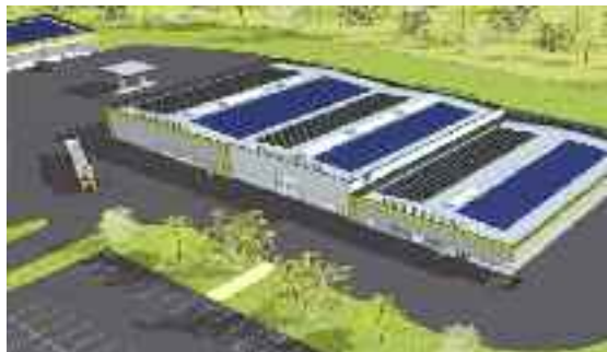
Schémas fournis par la société ARMORGREEN, installateur de la centrale.

Pour la Ville, cette centrale solaire photovoltaïque présente de nombreux aspects positifs. En effet, outre le fait de produire une électricité non polluante, cette centrale évite aussi le coût de la construction d'une toiture traditionnelle (75 000 € HT.) et elle permettra à la Ville de toucher une redevance annuelle d'occupation de 6 500 € (H.T.) pendant les 22 ans prévus par la concession. Enfin, dans le but de sensibiliser le grand public, un compteur de production instantanée d'énergie solaire sera installé à l'entrée du centre technique municipal.