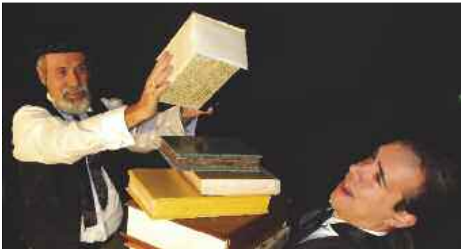
Les Bouffes de l'Ouest donneront deux représentations de leur spectacle, les 8 et 9 janvier.

Connaissez-vous Emmanuel Chabrier ? La compagnie des Bouffes de l'Ouest vous entraîne dans un spectacle original et insolite : "Charivari chez Chabrier" où l'on surprend l'emploi du temps fantaisiste du compositeur français Emmanuel Chabrier. Cette présentation est suivie de "L'éducation manquée", un petit bijou d'opérette