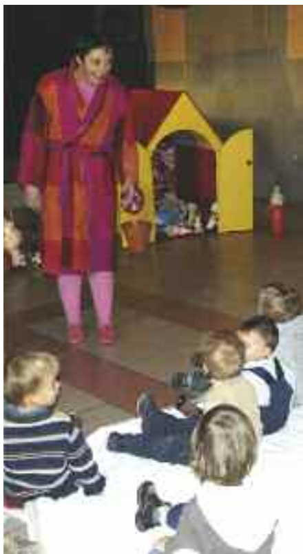
Un nouveau rendez-vous de Noël est proposé par les assistantes maternelles indépendantes, le 16 décembre.