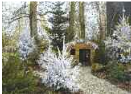
Le décor de Noël, aménagé par une équipe des espaces verts de la Ville, a pris place sur l'esplanade du centre culturel.

Vous pourrez profiter des décorations de Noël dans les tons blancs et bleus jusqu'au 7 janvier (les illuminations sont composées de lucioles et lampes à Led pour plus d'économies d'énergie), dans les secteurs de la Monnaie, des centres commerciaux Bour-