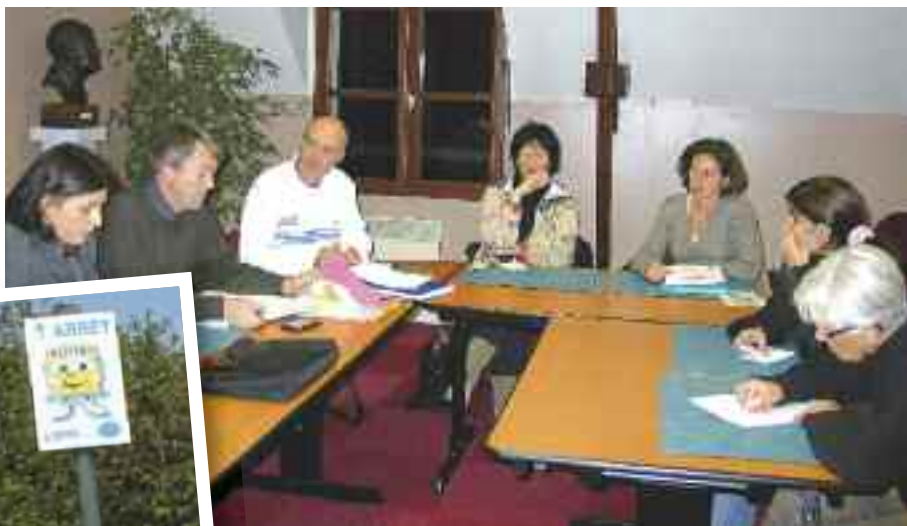
Une réunion s'est tenue le 18 novembre avec les élus, parents et bénévoles pour relancer le pédibus.

Le Pédibus est un accompagnement à pied d'un groupe d'enfants d'une même école par des parents ou des bénévoles qui, à tour de rôle, jouent les accompagnateurs en fonction de leur disponibilité. Le service fonctionne le matin comme un autobus avec des circuits, des horaires, des arrêts. C'est un service libre et gratuit !