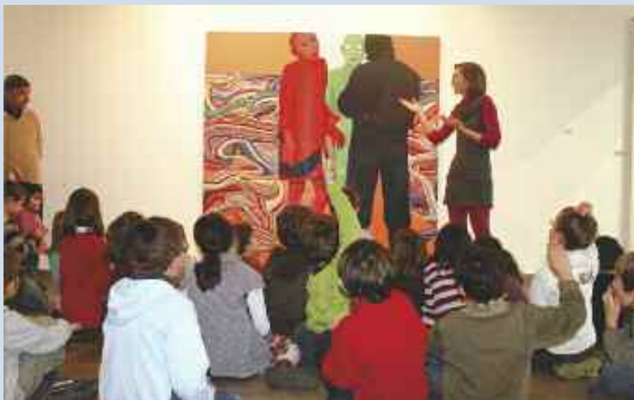
Une stagiaire en Histoire de l'art échange avec une classe de CE1 de l'école Bourgchevreuil autour du travail de Sylvie Fajfrowska.

>> Le pôle Arts Plastiques mène également un projet de coéducation avec les écoles pour favoriser les pratiques artistiques autour de la thématique annuelle. “Cette année, il s'agit de la métamorphose travaillée avec les CP de l'école Beausoleil et des CM2 de l'école Bourgchevreuil. Nous mettons à disposition nos locaux, nos outils et des enseignants en arts plastiques.”