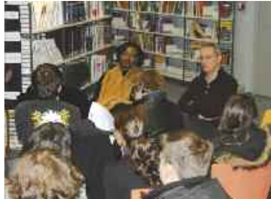
Léonara Miano a échangé avec des secondes et premières autour de l'Afrique et de la question "Être noir aujourd'hui".

L'écritrice camerounaise Léonara Miano a rencontré des élèves du lycée Sévigné, le 2 décembre. Un premier contact avait été établi lors du festival Étonnants Voyageurs à Saint-Malo, en mai dernier. Un travail avait été réalisé par une classe de seconde autour de l'un de ses livres. La rencontre entre l'auteure et les élèves avait été rapide et Léonara Miano avait proposé de les revoir. C'est avec gentillesse qu'elle a échangé avec une classe de seconde sur la thématique "Afrique, regards croisés" dans le cadre de littérature et société. Elle a ensuite rencontré les 1 res Littéraires autour du recueil de nouvelles paru en octobre : Blues pour Élise . Pour clôturer la journée, l'écritrice, qui a obtenu le prix Goncourt des lycéens en 2006 avec Contours du jour qui vient , a partagé un goûter littéraire et assisté à l'annonce des lauréats du concours de nouvelles organisé pour l'occasion.