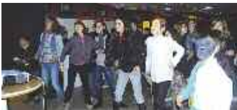
Environ 200 enfants de 8 à 13 ans se sont retrouvés pour partager de bons moments de convivialité au profit du Téléthon.

La commission Citoyenneté du Conseil Municipal des Jeunes (CMJ) a de quoi être satisfaite : la fête organisée dans le cadre du Téléthon, le 4 décembre, a été un véritable succès ! Environ 200 jeunes de 8 à 13 ans se sont retrouvés au Carré Sévigné de 17h à 21h pour partager un bon moment de convivialité pour une belle cause. "Les enfants se sont beaucoup investis, de l'organisation de la fête au ménage, en passant par la communication, la décoration de la salle, le choix des jeux et l'animation de la soirée", confiait Virginie Madec, animatrice à la direction Education-Jeunesse, coordinatrice du CMJ. En effet, les jeunes ont partagé des séances de karaoké, danse, jeux avec l'école de cirque "En piste !" et maquillage. Ce sont plus de 1 000 € qui ont été récoltés et seront intégralement reversés au comité local du Téléthon.