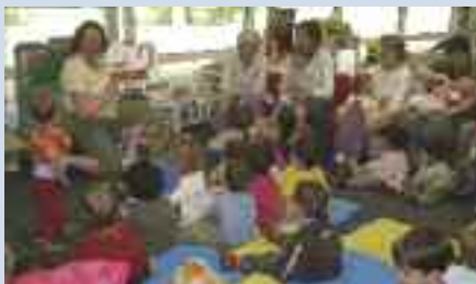
Séance lecture avec les assistantes maternelles de l'espace-jeu de la Maison de l'Enfance.

Une quarantaine de rendez-vous est organisée en lien avec la Maison de l'enfance, le