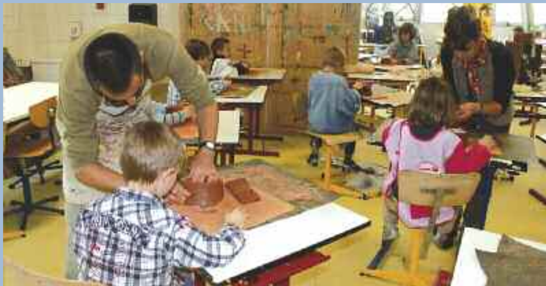
Sensibilisation aux arts plastiques pour une classe de CP de l'école Beausoleil.