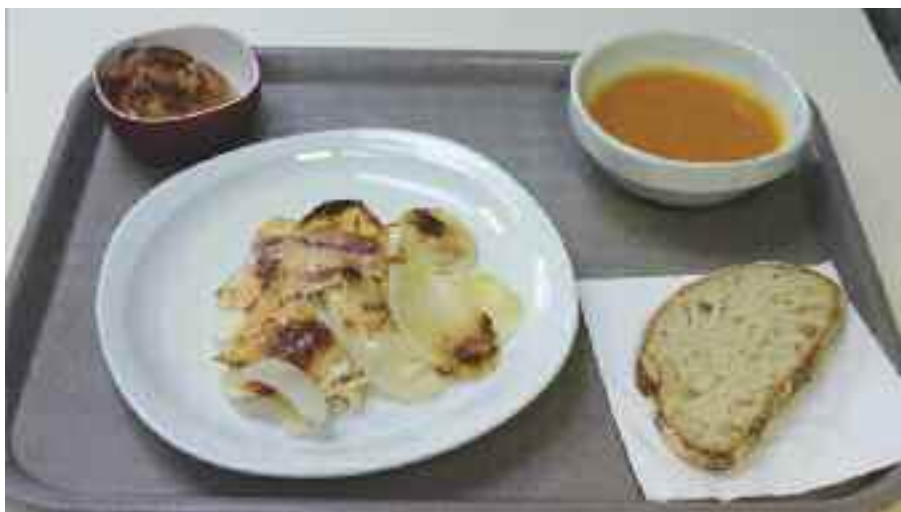
Un repas sans viande ni poisson est désormais proposé chaque mois.

Suite à une décision de la Commission de restauration scolaire, il est désormais servi aux enfants 1/2 pensionnaires un repas sans viande, ni poisson à raison d'une fois par mois. En effet, les nutritionnistes conseillent d'équilibrer notre alimentation avec 50 % de protéines animales et 50 % de protéines végétales. Actuellement, 70 % des protéines consommées dans le monde sont d'origine animale. Comme le montrent de nombreuses études, développer la part de protéines végétales de qualité dans notre alimentation en réduisant la part de protéines animales aurait un impact sen-