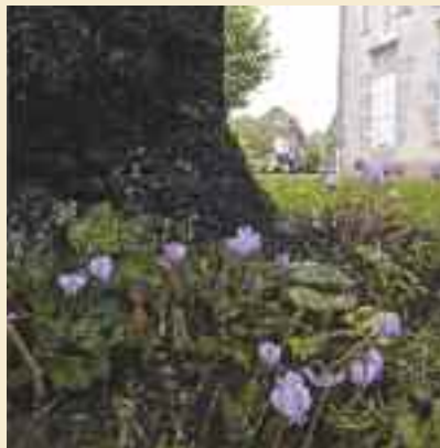
Regard curieux et malicieux du photographe sur la ville.