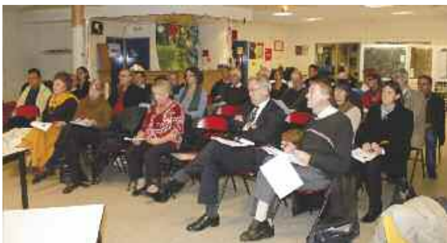
La direction Éducation-Jeunesse de la Ville a établi un état des lieux de l'offre d'activités aux 10-18 ans qu'elle a présenté aux acteurs locaux de la jeunesse, le 9 novembre.

S uite à la mise en place de son Projet Éducatif 2009-2012 en juin 2009, la municipalité a souhaité étendre sa politique Éducation-Jeunesse à l'ensemble des acteurs locaux, en vue d'élaborer un Projet Éducatif Local (PEL).