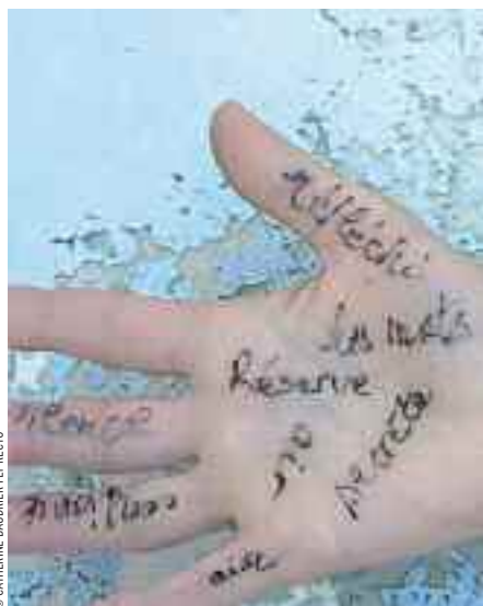
RECTO