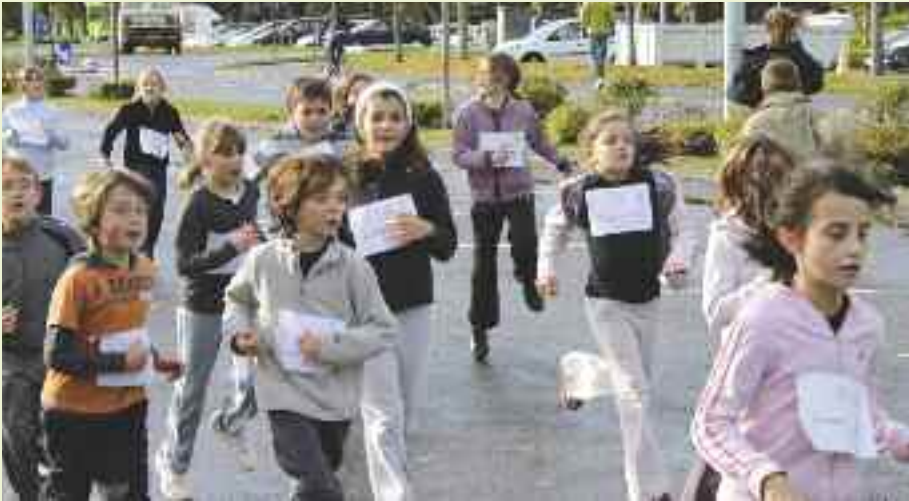
Les élèves du collège se sont élancés autour des étangs pendant que les CM2 courraient sur le parking Dézerseul.