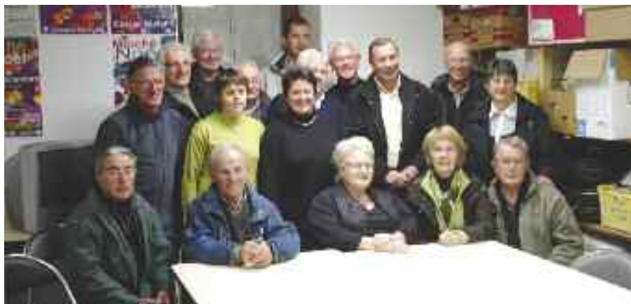
Dernière réunion de préparation pour le Comité de Jumelage.