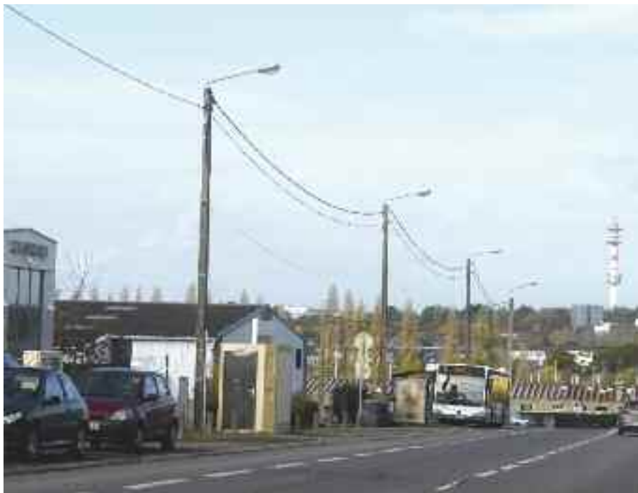
Les candélabres de la ZI Sud-Est, partie Cesson-Sévigné, représentent 6 % de l'ensemble de l'éclairage public de la commune. Ils seront coupés à partir du 3 décembre, entre 1h10 et 5h10.

Dans le cadre d'une démarche volontariste de développement durable et d'économies d'énergie, la Ville expérimente depuis le 15 juin la coupure de l'éclairage public entre 1h10 et 5h10 pour les quartiers résidentiels. Cette coupure va être étendue à la ZI Sud-Est, aux Peupliers et au Bordage à partir du 3 décembre.