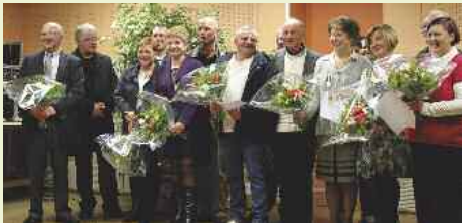
La Ville a fêté les décorations et départs à la retraite de plusieurs agents communaux.

Le Préfet a décerné plusieurs médailles à des agents communaux pour services rendus à la collectivité. L'occasion pour la Ville de fêter ces décorations et plusieurs départs à la retraite, le 19 novembre à la Maison des associations de la Touche Ablin.