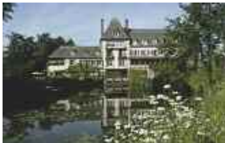
L'hôtel-restaurant Ar Milin, à Châteaubourg, fait partie de l'association.

Mis en ligne en 2005, il permet un accès simplifié à l'information (recherche multicritères, fiche technique par établissement, offres spéciales, photothèque, évé-