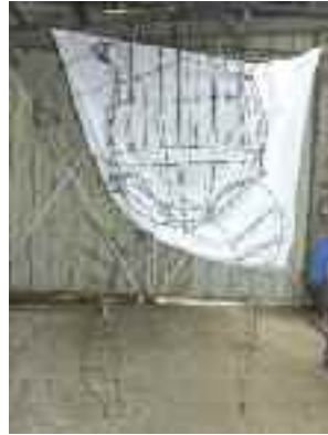
Mister Bobbles a été construit aux services techniques municipaux.

La résidence de l'auteur Philippe Le Cacheux, au Centre culturel, débutera le samedi 4 décembre par une soirée autour de deux histoires musicales données par les élèves de l'école de musique et de danse de la ville, ainsi que les artistes de la Cie Le Cabaret Nomade. Cinq artistes ont travaillé à la construction d'une marionnette géante de trois mètres de haut représentant Mister Bobbles, un des personnages de l'histoire “Qui a tué Barnabé ?”. Mobile et articulée, cette marionnette sera présente pour le spectacle et sera le fil rouge de la résidence. Vous pourrez même la voir dans les rues de la ville d'ici quelques semaines ! Les étapes de sa construction sont à découvrir sur le site : http://bobbles.over-blog.com/ .