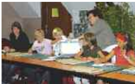
Les jeunes ont voté pour choisir le projet du futur Espace Citoyens parmi les trois présentés.

Les trois projets en compétition pour l'aménagement du futur Espace Citoyens ont été exposés dans le hall de la mairie du 7 juillet au 8 septembre. L'objectif était de recueillir l'avis des citoyens sur ce grand projet.