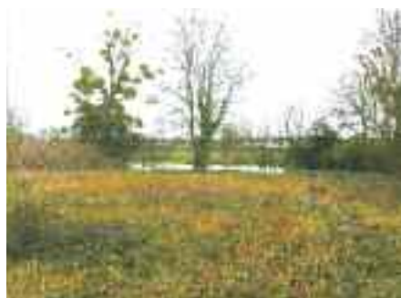
Avec cette acquisition, la Ville conserve des champs d'expansion des crues.