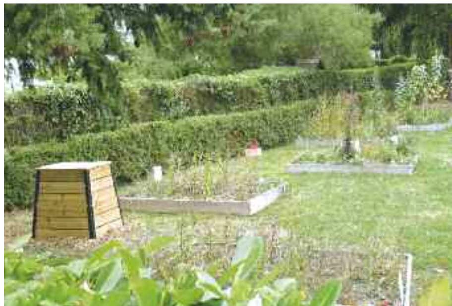
La maternelle Beausoleil possède des petits jardins potagers.

Élémentaire Bourgchevreuil : création de quatre jardins potagers.