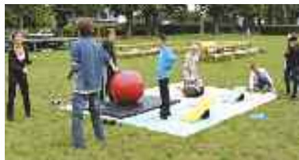
Jeux et expo photos étaient présentés au Placis Vert.

Champagné) et 02 99 83 09 68 (Etournel – rue Carrick-On-Shannon).