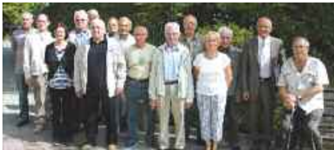
Une quinzaine de bénévoles du Comité des Fêtes assure l'organisation en amont de la braderie.