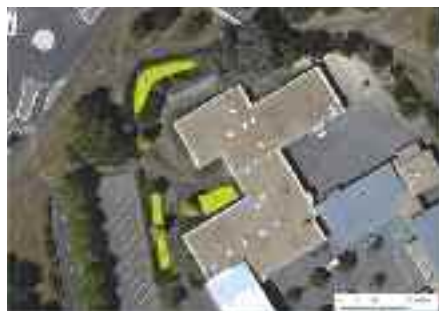
Les parcelles proposées pour une mise en gestion différenciée à l'école Beausoleil et Bourgchevreuil.