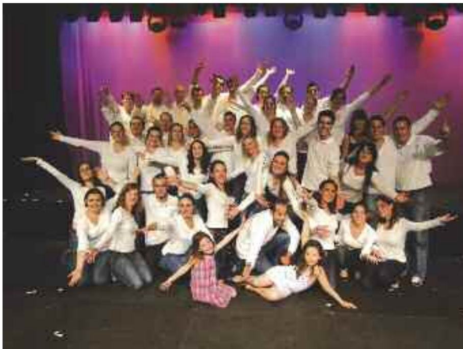
La troupe Païdeïa animera la kermesse Saint-Martin, le dimanche 26 septembre.

La paroisse Sainte-Catherine-de-Sienne organise, le dimanche 26 septembre, la kermesse Saint-Martin sur la place de l'Église. Voici le programme :