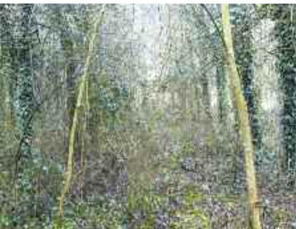
Le site doit être défriché et remis en valeur.

plantés il y a une quinzaine d'années occupent la plus grande partie du site, lui-même séparé en deux par un 3 e bras de Vilaine. De larges allées avec quelques clairières permettent une balade agréable autour de la Grande Isle. Mais laissé à l'abandon quelques années après la réalisation de la rocade Est, le foncier doit être défriché et remis en valeur. Il y a là matière à organiser, par exemple, un chantier d'insertion.