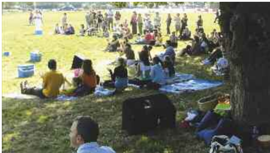
De nombreux habitants avaient participé au 1 er rendez-vous des Glacières Bleues de l'été, en septembre 2009.

La 2 e saison des Glacières Bleues de l'été est un programme proposé par la Ville de Cesson-Sévigné pour partager un pique-nique artistique. Vous apportez votre glacière et nous vous proposons d'agrémenter votre repas avec un spectacle. L'objectif est de venir près de chez vous, de faire se rencontrer les habitants de la commune. Rendez-vous le