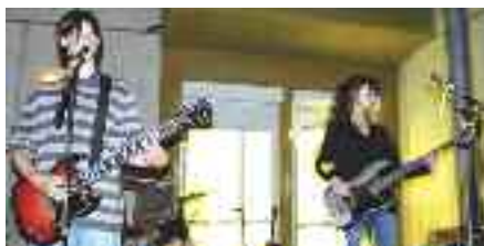
Absynthe et Hairgass ont donné un concert sous le préau de l'école Bourguevreuil.