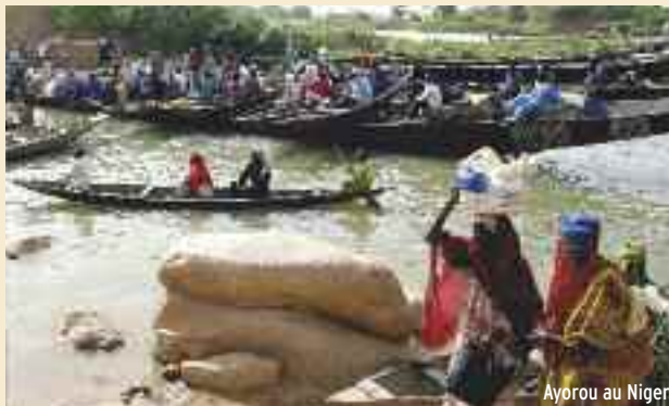
Ayorou au Niger

L'idée de ce reportage photographique est née d'une envie des deux photographes d'aller, en partant de Niamey, le long du fleuve Niger sans le traverser, à la rencontre des hommes, des femmes et des paysages jusqu'à Ségou, au Mali. Pendant un mois, ils ont visité les villages et les îles qui bordent le fleuve. Pour Abdoul Aziz, ce voyage représentait l'occasion de mieux connaître le peuple sonhraï dont il parle un des dialectes, le Zarma. Pour Jean-Pierre, ce voyage lui a permis de rencontrer sous un autre jour, grâce à Abdoul Aziz, les habitants du fleuve. Un voyage photographique qui traverse Tillabéri, Gao,