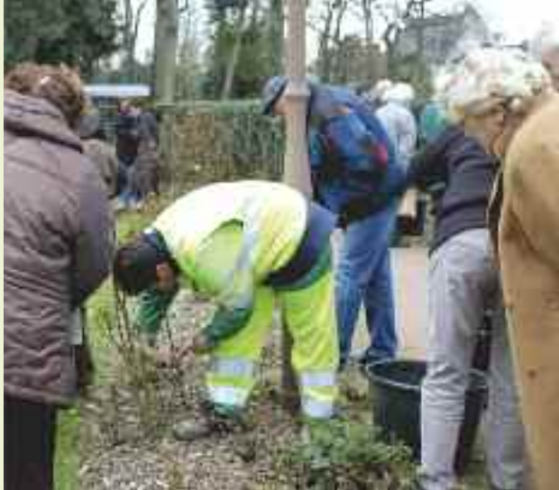
Jolie succès pour la démonstration de taille des rosiers. D'autres seront proposées.

La Ville de Cesson-Sévigné, en partenariat avec la Société d'horticulture d'Ille-et-Vilaine, a proposé une demi-journée de démonstration gratuite à la taille des rosiers, le 9 mars dans la roseraie du parc de Bourgchevreuil. Ce premier rendez-vous a attiré plus de 70 personnes avides de conseils. Les particuliers ont ainsi pu échanger sur des savoir-faire avec des bénévoles très éclairés de la Société d'horticulture et des professionnels du service Environnement et Cadre de vie de la Ville. D'autres manifestations seront envisagées sur les arbustes à fleurs (camélia, rhododendrons...) et les arbres fruitiers.