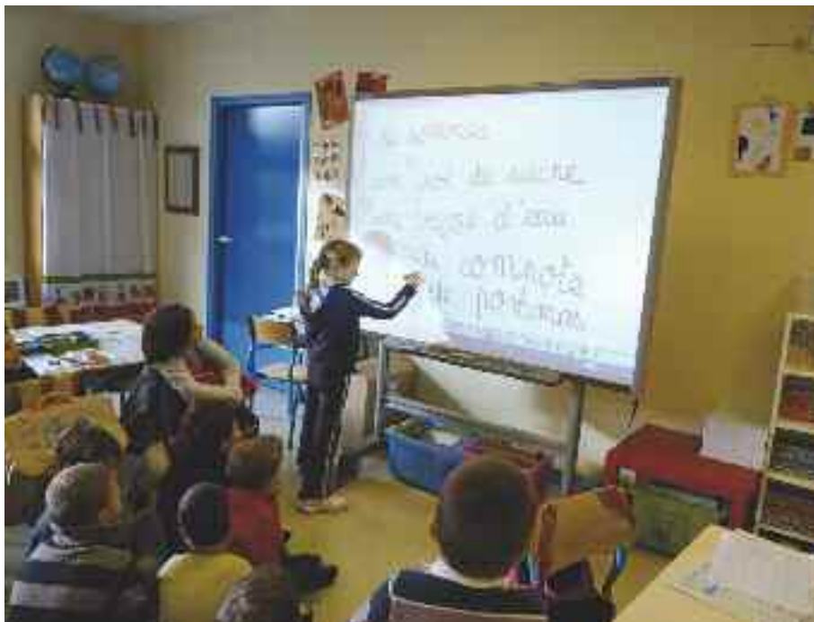
Le tableau blanc interactif enthousiasme les élèves

Une classe de CP de l'école Notre-Dame expérimente le tableau blanc interactif, qui motive particulièrement les élèves.