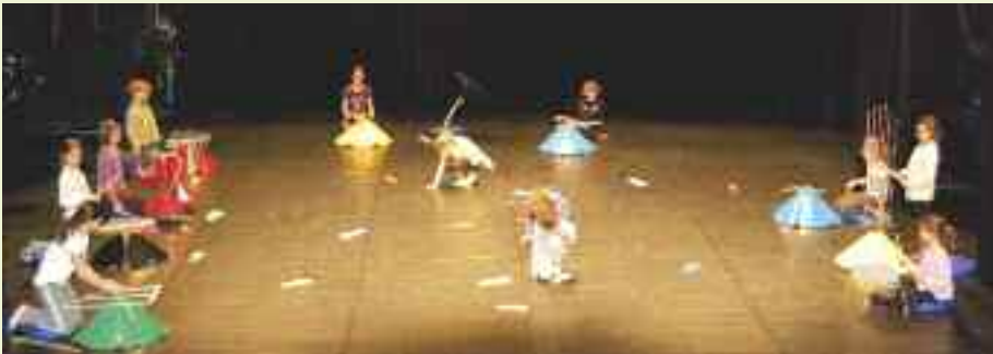
Les enfants étaient pressés de revenir chaque jour pour répéter avant de donner une représentation, le 10 mars.

Organisé par le pôle Musique et Danse de la Ville, un stage a eu lieu du 7 au 10 mars autour des structures sonores Baschet et de la danse. Durant 4 jours, à raison de 6 heures quotidiennes et grâce aux professeurs Armelle Lurton et Geneviève Seroux, une douzaine d'enfants de 8 à 11 ans a découvert comment se monte un spectacle et ce que cela implique : travail du corps, de la voix, musique