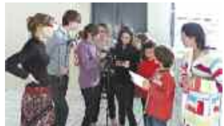
Les jeunes de l'Etournel ont réalisé un petit reportage autour, notamment, de la diversité sportive. Ici, à la piscine sports et loisirs.

mai et juin pour une présentation commune des films réalisés puis détournés. Les séances seront animées par l'association de défense du téléspectateur "Les pieds dans le paf". Des ateliers de décryptage seront également organisés. Enfin, la seconde partie consistera en une exposition. "Dessins de presse à la une", prêtée par Les Champs Libres, sera présentée à l'Etournel du 25 avril au 6 mai. De nombreuses animations auront également lieu autour de ce thème et des médias en général.