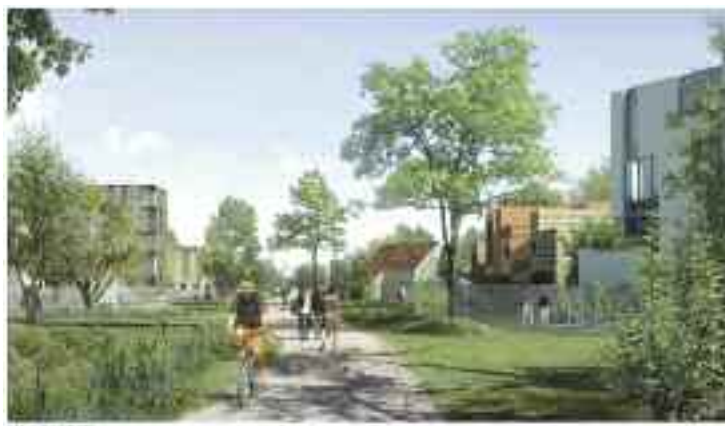
ViaSilva : la ville dont la trame est un jardin - Projet Devillers et associés.