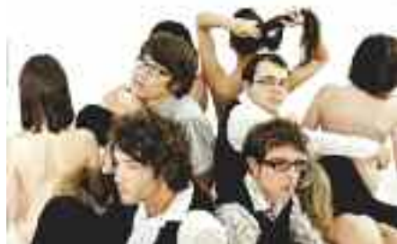
The Wankin'Noodles sera en concert gratuit au centre culturel.

Le groupe, originaire de Saint-Brieuc et de Rennes, a été découvert lors des Trans Musicales en 2008. Il