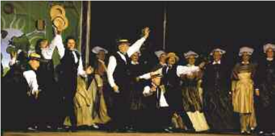
Les Perrières de Cesson-Sévigné lors de leur participation au Festival international folklorique de Cantanhede (Portugal), en 2009.

Le Cercle celtique a été invité à participer au Festival international de danse d'Ankara, lequel se déroule sous le haut patronage du secrétariat général de l'Union européenne. Il est pris en charge et organisé par la Ville d'Ankara. Le groupe des danseurs des Perrières représentera donc la France et Cesson-Sévigné lors de ce festival. La troupe a, de ce fait, travaillé d'arrache-pied durant tout l'hiver afin d'être en mesure de présenter sa nouvelle choré-