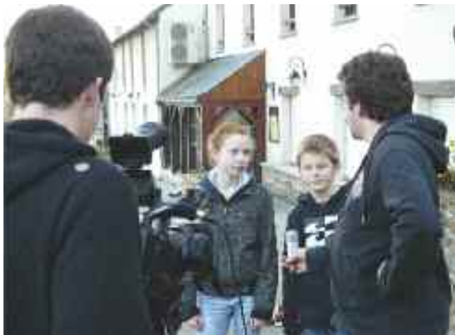
Des étudiants de l'Esra Bretagne ont réalisé un petit reportage sur le CMJ de Cesson.

Le Conseil municipal des jeunes s'est réuni pour une nouvelle séance, le 17 mars en mairie. L'assiduité des jeunes élu(e)s et la variété de leurs engagements sont d'ailleurs à souligner.