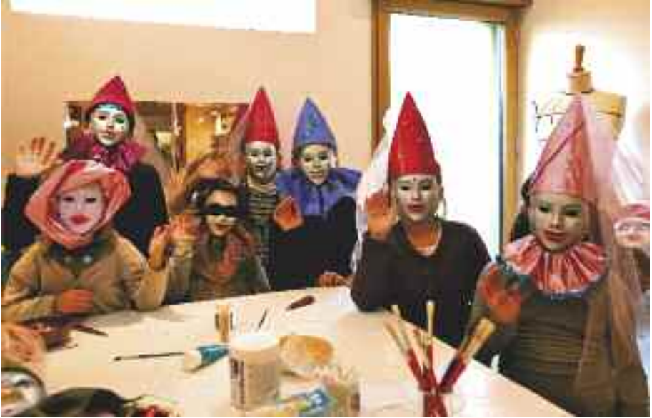
L'atelier "Masques vénitiens" du 19 février s'est déroulé dans la bonne humeur avec les jeunes créateurs !

L'association vous invite à préparer Pâques dans la gourmandise en réalisant une "petite bourse japonaise surprise" et un "lapin couvre-œuf gourmand" , le samedi 9 avril de 14h à 17h. Techniques utilisées : coupe, pliage et points