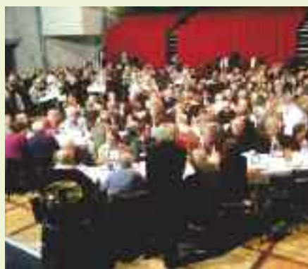
526 convives ont partagé le repas, véritable moment d'échanges.

V éritable temps de convivialité et d'échanges, le repas des aînés, organisé et offert par la Ville aux personnes âgées de 68 ans et plus, a eu lieu le 5 mars au Carré Sévigné. Ils étaient 526 à s'être inscrits pour y participer. Ce gros travail de préparation et de distribution a mobilisé autour des élu(e)s, la direction de l'Action Sociale et des Solidarités de la mairie, les résidents du foyer logement Automne, auteurs de la carte des menus, des jeunes de l'Escalpe pour la réalisation des centres de table, la joyeuse troupe de la Retraite Active et la chorale de l'Amicale des Retraités pour les animations, le personnel d'Ansamble et 22 jeunes serveuses et serveurs. Ce rendez-vous incontournable sera organisé un peu plus tôt en 2012. Des enfants pourraient être associés à l'animation.